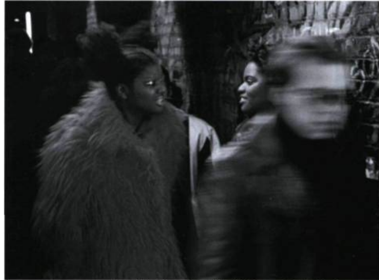
Line-Up – Superficialité des modes éphémères