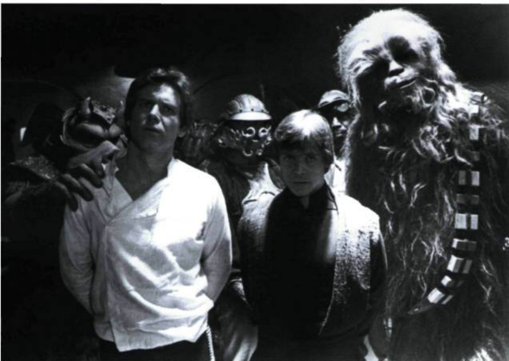
Return of the Jedi

au cinéma. Ses recettes considérables ont amorcé la course aux records de recettes brutes au premier week-end qui règlent le sort de la carrière de tous les films sortant en salle aujourd'hui, peu importe leur importance, leur budget ou leur origine, la grande majorité des exploitants de salles étant à la merci du bon vouloir des bonzes de Hollywood, qui les inondent de copies multiples en exigeant généralement plusieurs semaines d'exclusivité. Si le film d'action estival est né le 20 juin 1975 avec Jaws , c'est avec Star Wars en 1977 que la véritable révolution a eu lieu et que le concept du Summer Movie Blockbuster est né. Jour férié exclusivement américain, Memorial Day est pourtant passé dans le langage commun pour marquer le début de la saison estivale, partout à travers le monde.