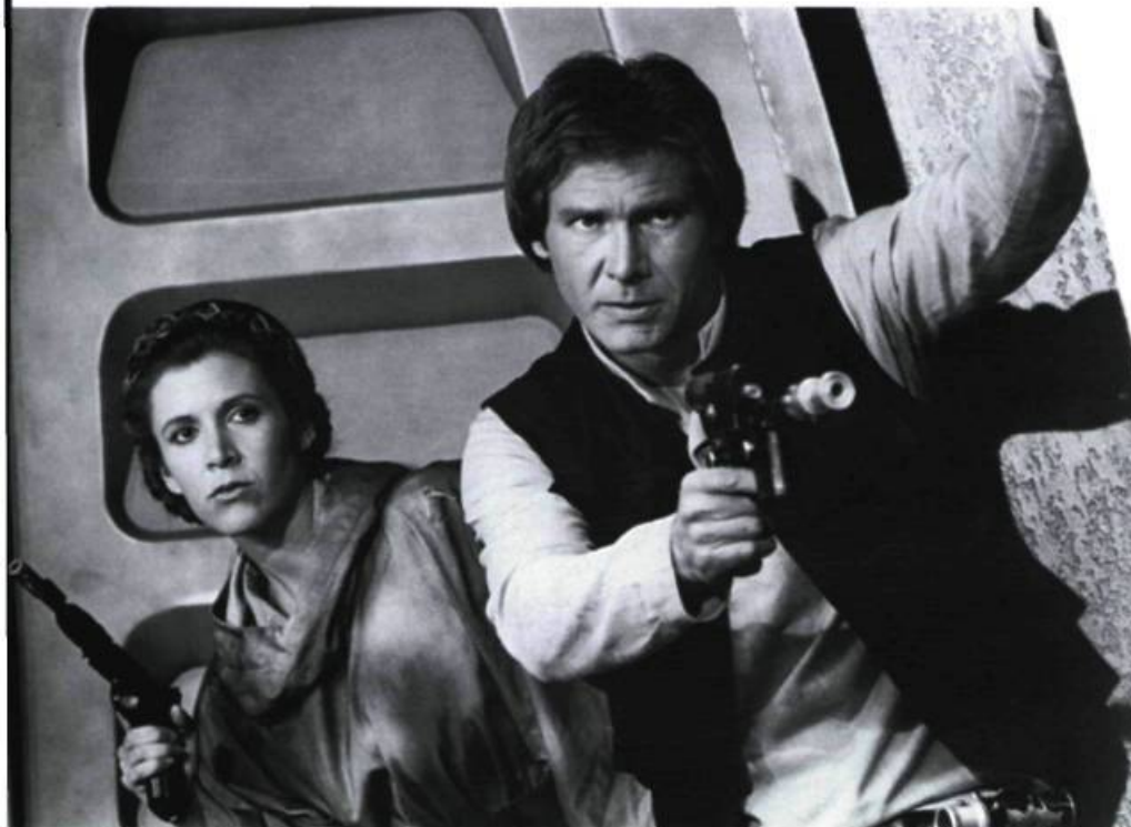
Return of the Jedi

Contre toute attente, Star Wars , film sans stars dont l'acteur le plus célèbre (Alec Guinness/Obi-Wan Kenobi) était totalement inconnu du jeune public et avait à toutes fins pratiques disparu des écrans depuis des années, a relancé une saison jusqu'alors morte