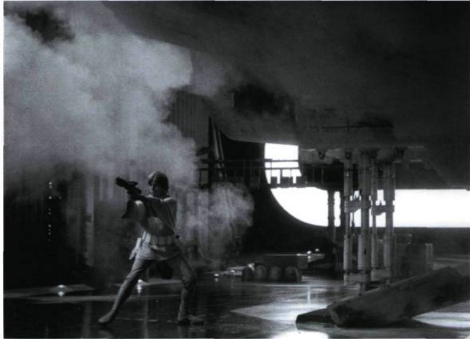
Star Wars: A New Hope