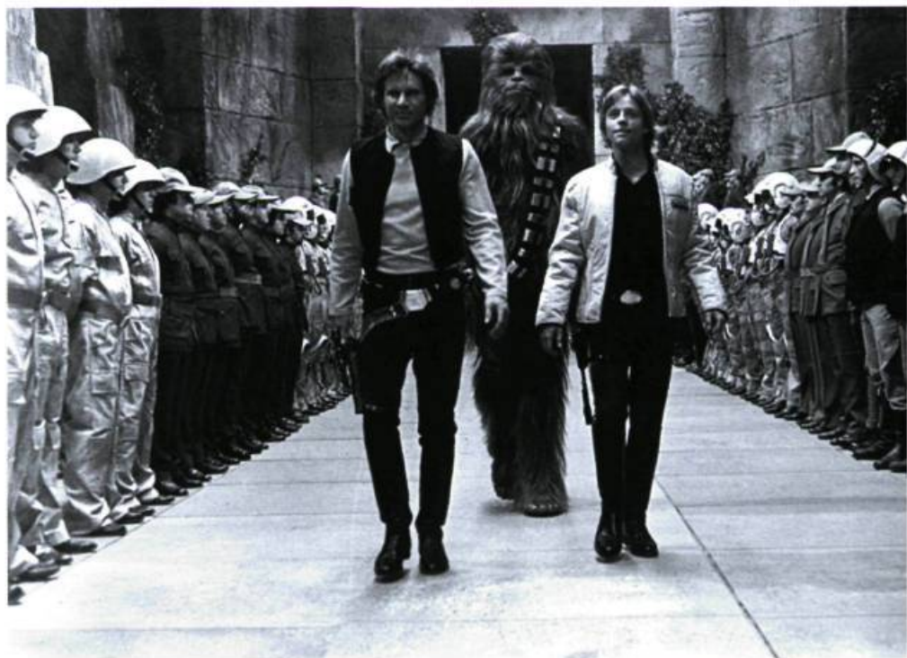
Star Wars: A New Hope

Ainsi, aujourd'hui, s'il est vrai que The Phantom Menace bénéficie probablement de la plus importante et de la plus efficace cam-