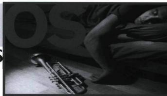
La solitude du cœur et du corps