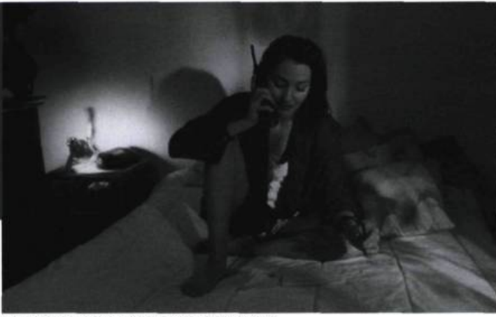
Le téléphone, substitut de la présence physique

Ces mutations dans les modes relationnels et la culture sont représentatives de notre modernité. L'absence de rapports sociaux, que plusieurs humanistes ont récemment constatée, est compensée par la technologie et les images. L'être humain habite un environnement de plus en plus virtuel.