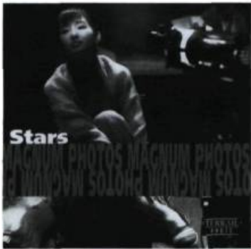
Films Stars. Photographs of Magnum Photos/Photographies de Magnum Photos Fotografien von Magnum Photos Collectif Paris, Éditions Pierre Terrail, 1998 64 pages