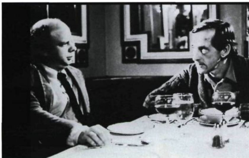
Un tête-à-tête, condensé d'une époque