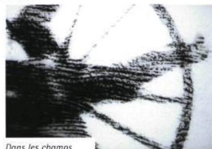
Dans les champs

Le festival du Nouveau Cinéma et des Nouveaux Médias s'est ancré encore plus cette année dans l'histoire de ses champs d'activité, en rendant hommage à l'artiste polymorphe Michael Snow, au documentariste français Nicolas Philibert, au scénariste britannique de la télévision Dennis Potter — dont j'ai pu me délecter ainsi de plusieurs œuvres — et au grand cinéaste d'animation polonais Jerzy Kucia. Cet hommage tenait en des rencontres avec le cinéaste à l'occasion d'une rétrospective de son œuvre complète à la Cinémathèque québécoise.