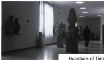
Guardians of Time