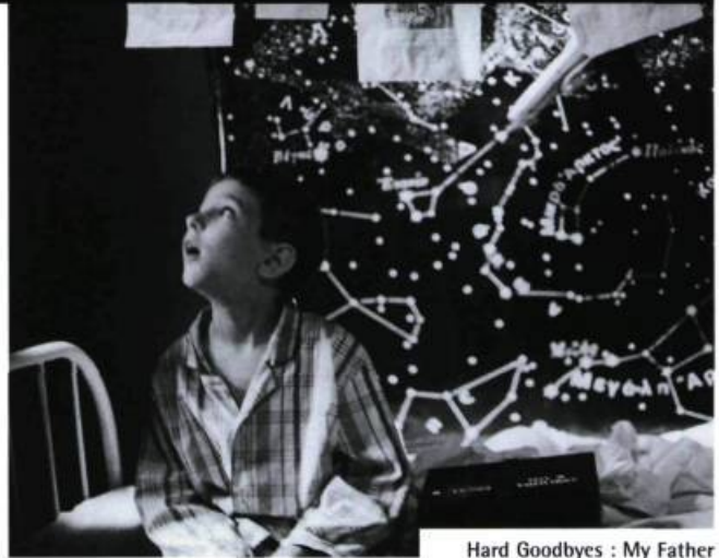
Hard Goodbyes : My Father