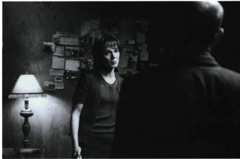
Regards et non-dits

À cela sont également juxtaposés un montage éclectique, serré et syncopé, des cadrages originaux, des plans rapprochés et différents procédés techniques — plongées, contre-plongées, effets de stroboscope, stop motion , fondus enchaînés, etc. — qui donnent à cette production de 4,6 millions de dollars tournée en 29 jours une mouvance soutenue.