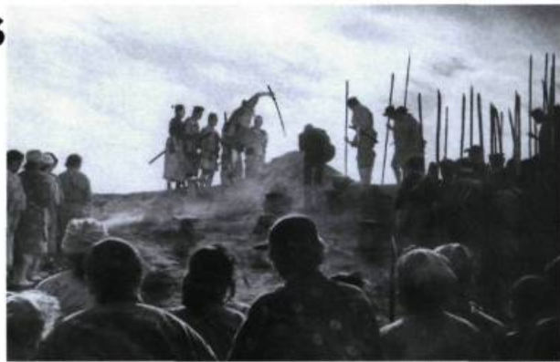
Une vigoureuse élégie