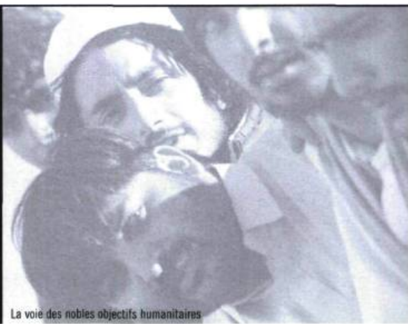
La voie des nobles objectifs humanitaires