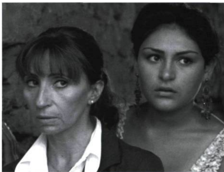
Le Voyage en Arménie

Votre remarque n'est pas futile. L'Arménie, c'est tellement tragique. Pas seulement depuis le génocide, mais depuis la nuit des temps. Donc, j'étais persuadé qu'il fallait faire un film léger, un film solaire. Les talons aiguilles, ça me permettait pas mal de choses sur le personnage. D'abord, ça la mettait en déséquilibre et le personnage est constamment en déséquilibre. Ça soulignait aussi le fait qu'Anna est partie de Marseille en se disant qu'elle allait tout de suite retrouver son père et le ramener par la peau du cou. Elle ne s'attendait pas à crapahuter dans les montagnes, croyant qu'elle resterait à Erevan, dans son chic hôtel. Et puis il y a une tradition de cordonniers chez les Arméniens de la diaspora. Sur l'établi du père d'Anna, il y a des formes de chaussures. Et quand il la revoit, il admire ses souliers et lui dit : « Je t'aurai au moins légué ça. » Si les Arméniens de la diaspora ont souvent été tailleurs ou cordonniers, ce n'est pas une tradition millénaire, ils étaient plutôt à l'origine paysans. C'est qu'après le génocide, la Croix-Rouge apprenait aux orphelins des métiers artisanaux très concrets qui pouvaient servir tout de suite.