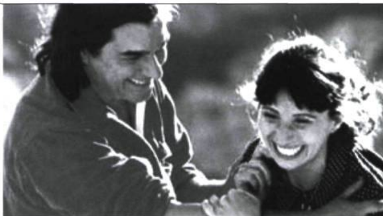
Marius et Jeannette