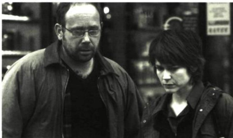
La Petite Chartreuse

Malgré tout, ce serait « dans la seconde » qu'elle viendrait dans la Belle Province, si on lui offrait un rôle intéressant et si... elle avait le temps. Toutefois, l'actrice dit avoir tourné la page sur Montréal et sa maison est maintenant Paris. « Quand j'arrive à Montréal, j'ai perdu tous mes repères. Je vais voir des amis, mais c'est surtout eux qui viennent me voir. C'est sûr que je