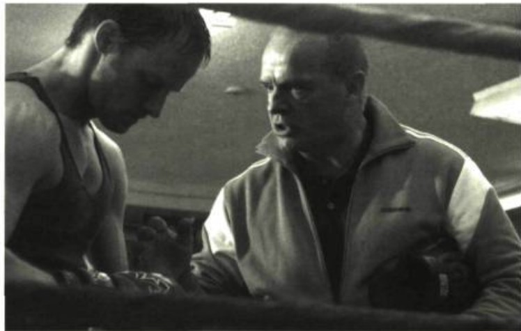
Des êtres de chair et de sang

Ici, par contre, point de héros à la Rocky, mais des êtres de chair et de sang, à l'âme sensible, aux cordes émotives fragiles, individus ordinaires qui se battent pour la réussite et la préservation du sentiment d'amitié. Ici aussi, il ne s'agit pas du rêve américain, mais de survie. Brillamment réussi dans son innocence calculée, La Ligne brisée ne prétend rien de plus que de divertir avec intelligence, sans susciter un quelconque débat.