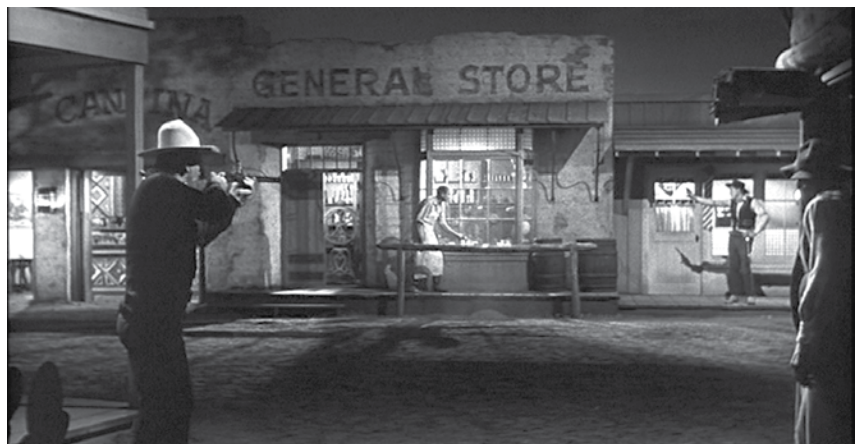
The Man Who Shot Liberty Valance

Le personnage de James Averill aura, quant à lui, perdu tout ce en quoi il croyait, notamment ses idéaux d'égalité sociale et l'amour d'une femme. Le film se termine avec une séquence magnifique, extrêmement mélancolique. De retour dans l'est du pays une dizaine d'années après les événements principaux du récit, Averill porte les traits désabusés d'un vieillard et affiche un