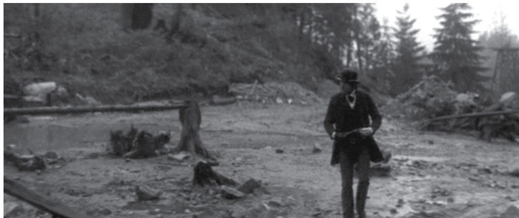
McCabe & Mrs. Miller

Si John McCabe, protagoniste du sous-estimé McCabe & Mrs. Miller (Robert Altman, 1971), n'est pas véritablement un revenant, il incarne certes la figure de l'étranger. Dès la séquence initiale, Altman nous présente McCabe comme un anti-héros. Dans un décor automnal, on voit, en plongée, un homme s'approcher au loin dont on ne peut pas encore deviner les traits puisqu'il est couvert de fourrure de la tête au pied. Le ton est donné pour un western crépusculaire sous la pluie, dans la neige et la