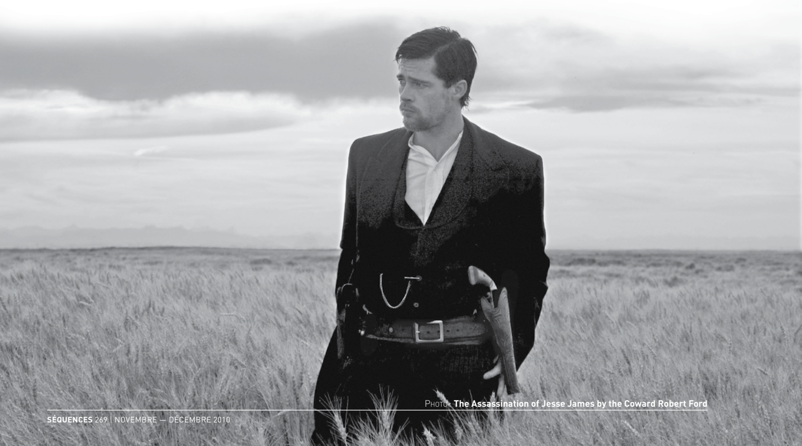
PHOTO: The Assassination of Jesse James by the Coward Robert Ford

Le grand maître John Ford réalise, en 1962, The Man Who Shot Liberty Valance , l'un de ses derniers westerns, mais aussi l'un des premiers films réflexifs du genre. Ford y fait preuve d'un travail remarquable de conscience critique et de démythification d'un genre cinématographique qu'il a pratiquement édifié lui-