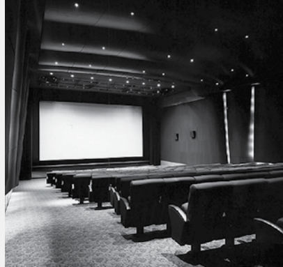
Prochaine réouverture de la salle Cassavetes