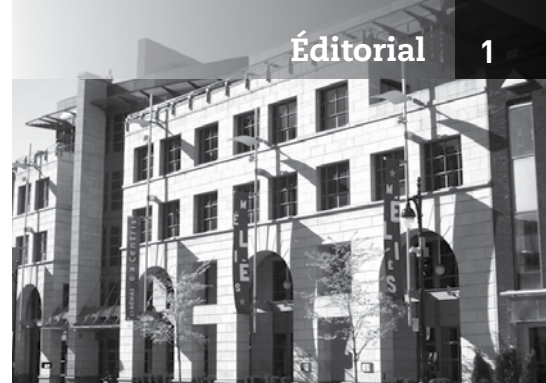
... et du Complexe Ex-Centris