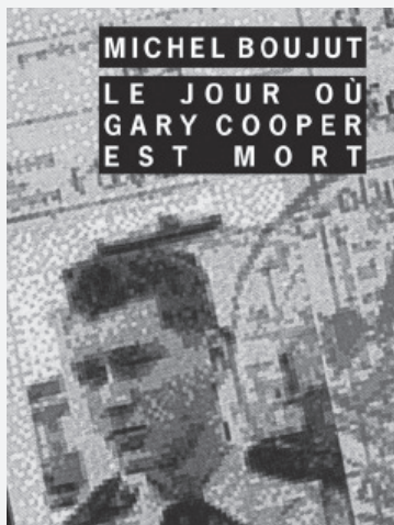
Le jour où Gary Cooper est mort Michel Boujut Paris: Rivages, 2011 169 pages

[1] Michel Boujut a collaboré aux Nouvelles littéraires , à Charly Hebdo , à A Suivre , à Positif entre autres; il est à l'origine de l'émission de télévision Cinéma, Cinémas . Il est l'auteur de Michel Soutter, L'Âge d'homme 1974, Alain Tanner, L'Âge d'homme 1990, Conversations avec Claude Sautet , Actes Sud / Institut Lumière, 1992.