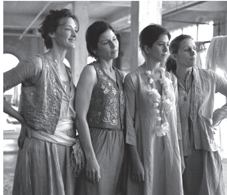
Friends With Money

3. Présence d'un degré d'autonomie entre chaque histoire: Lorsqu'on tente de résumer un film choral, il n'est pas rare de rencontrer certaines embûches. En effet, synthétiser, en tâchant de ne rien omettre de chaque sous-intrigue, est une tâche parfois complexe. Le résumé présent sur la jaquette du film Le Goût des autres (2000) d'Agnès Jaoui illustre très bien l'absence d'intrigue centrale: « C'est l'histoire d'un chef d'entreprise qui rencontre une actrice qui est amie avec une serveuse qui rencontre un garde du corps qui travaille avec un chauffeur qui conduit une décoratrice qui est la femme du chef d'entreprise qui voudrait être ami avec des artistes... »