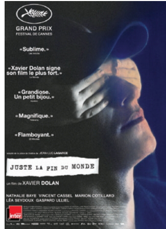
Juste la fin du monde Xavier Dolan