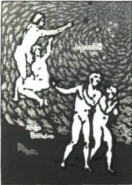
Dante's Inferno (extrait) de Tom Phillips, 1985