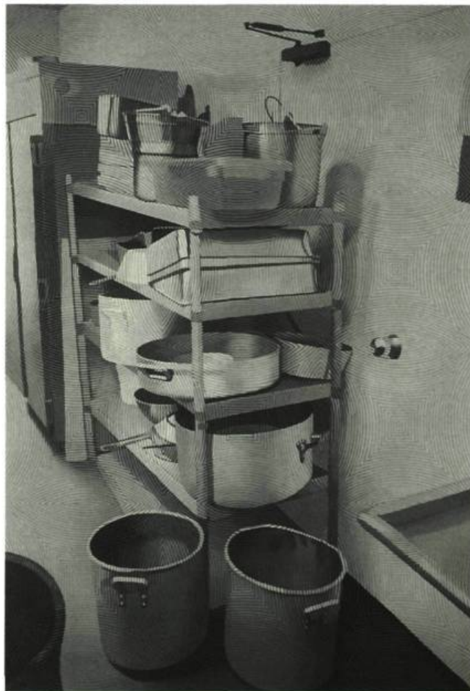
3 dans 4 de Numa, acrylique sur toile, 1999

Bref, après avoir fait de VTO, dans La terre sous ses pieds , le plus grand groupe rock de la