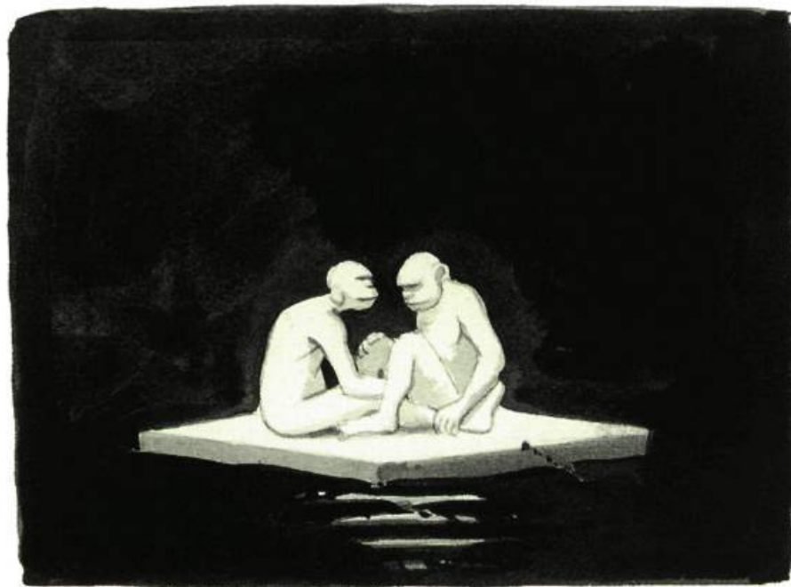
Styx de Edmund Alleyn, 2001

canne, comme Œdipe; des couples éparpillés, sur fond évanescant, vivent leur paternité, leur maternité, leur solitude partagée. Dans cette Belle fin de journée , le personnage le plus âgé est le plus souriant, comme s'il regardait ironiquement le visiteur-voyeur, comme s'il se moquait de la situation même de l'exposition, de l'art illusionniste, de la vie, quoi. Au cours d'une rencontre récente, Alleyn me rappelait, en souriant, que je n'avais pas noté la ressemblance de ce personnage avec Borduas. Intéressant! Borduas ou pas, cet homme est mon personnage préféré. Avec celui d'un petit garçon, tenant la main de sa mère