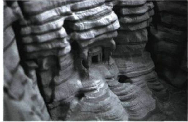
Guy Laramée, Biblios (détail).

politique, il reste que son potentiel intellectuel n'a pas encore été entièrement déployé : il semble que les Américains aient mal politisé la théorie française, ne retenant qu'une partie de la complexité des rapports interhumains et les microfascismes qui peuvent en découler dans l'ordre du monde orienté non plus par la domination mais par le contrôle.