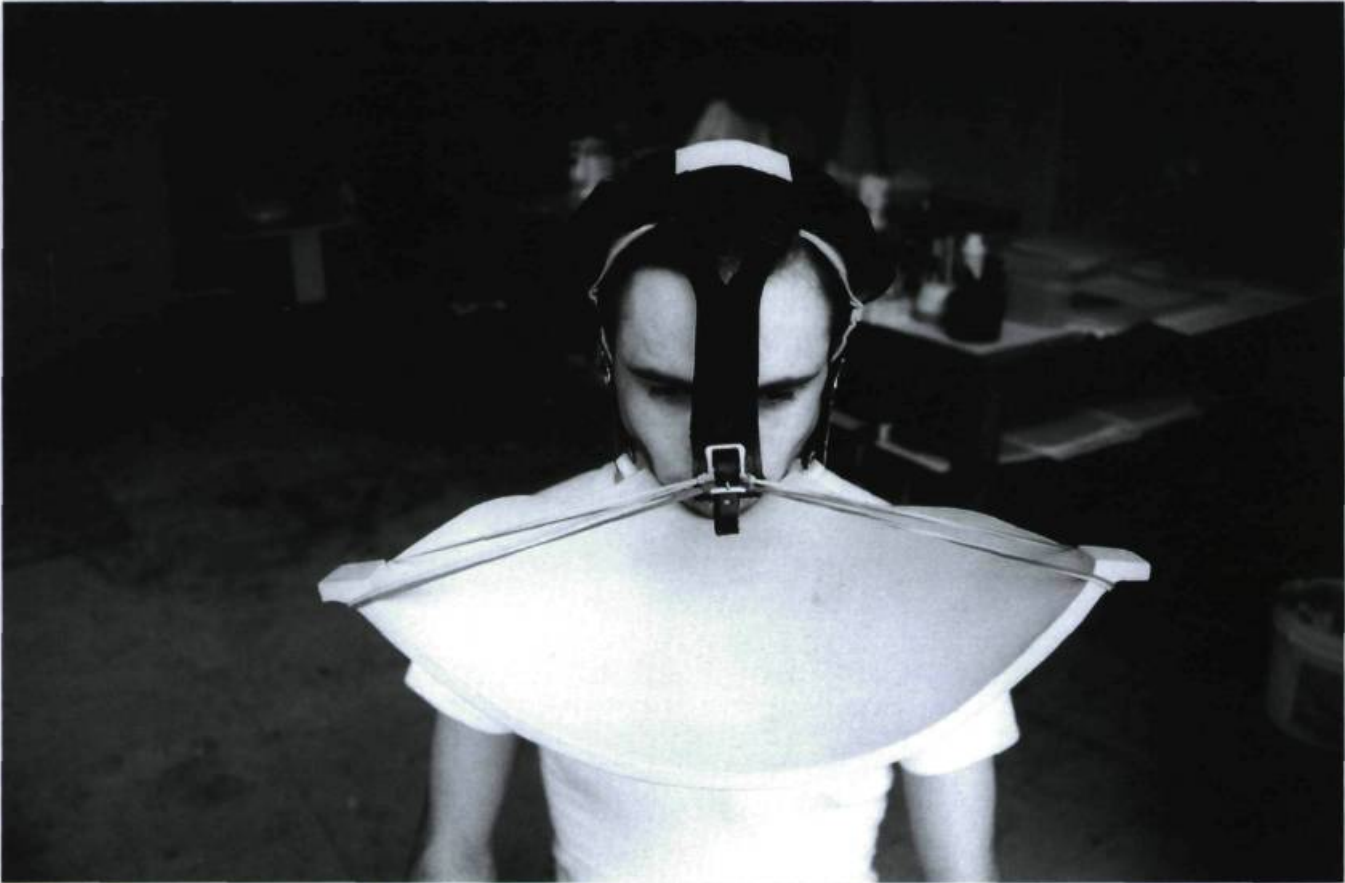
Massimo Guerrera, La Cantine (bavette C-13) , 1996, photographie noir et blanc

« Les sorties (1,2 et 3) de La Cantine de Massimo Guerrera dans les rues de Montréal ont permis de révéler quelques-unes de ces lois symboliques invisibles qui, balisant les espaces publics, déterminent les rapports entre le corps et la spatialité, et structurent les liens des corps entre eux. Ces lois symboliques définissant l'espace public consistent en cela : des droits que l'on se donne ou ne se donne pas à être physiquement présent là où on est, et par lesquels on se définit face aux autres. Cette interaction entre l'œuvre et son public fait partie de la finalité de l'art depuis quelque temps déjà – les installations en des lieux publics ne sont pas une nouveauté – mais ce qui mérite d'être analysé dans le travail actuel de Massimo Guerrera est le mode par lequel les interactions suivent les voies de passage de la nourriture, faisant de l'incorporation du regardant dans l'œuvre plus qu'une métaphore, une actuelle constitution d'un corps commun » (Jean-Ernest Joos, « Envois/renvois », propos sur La Cantine de Massimo Guerrera).