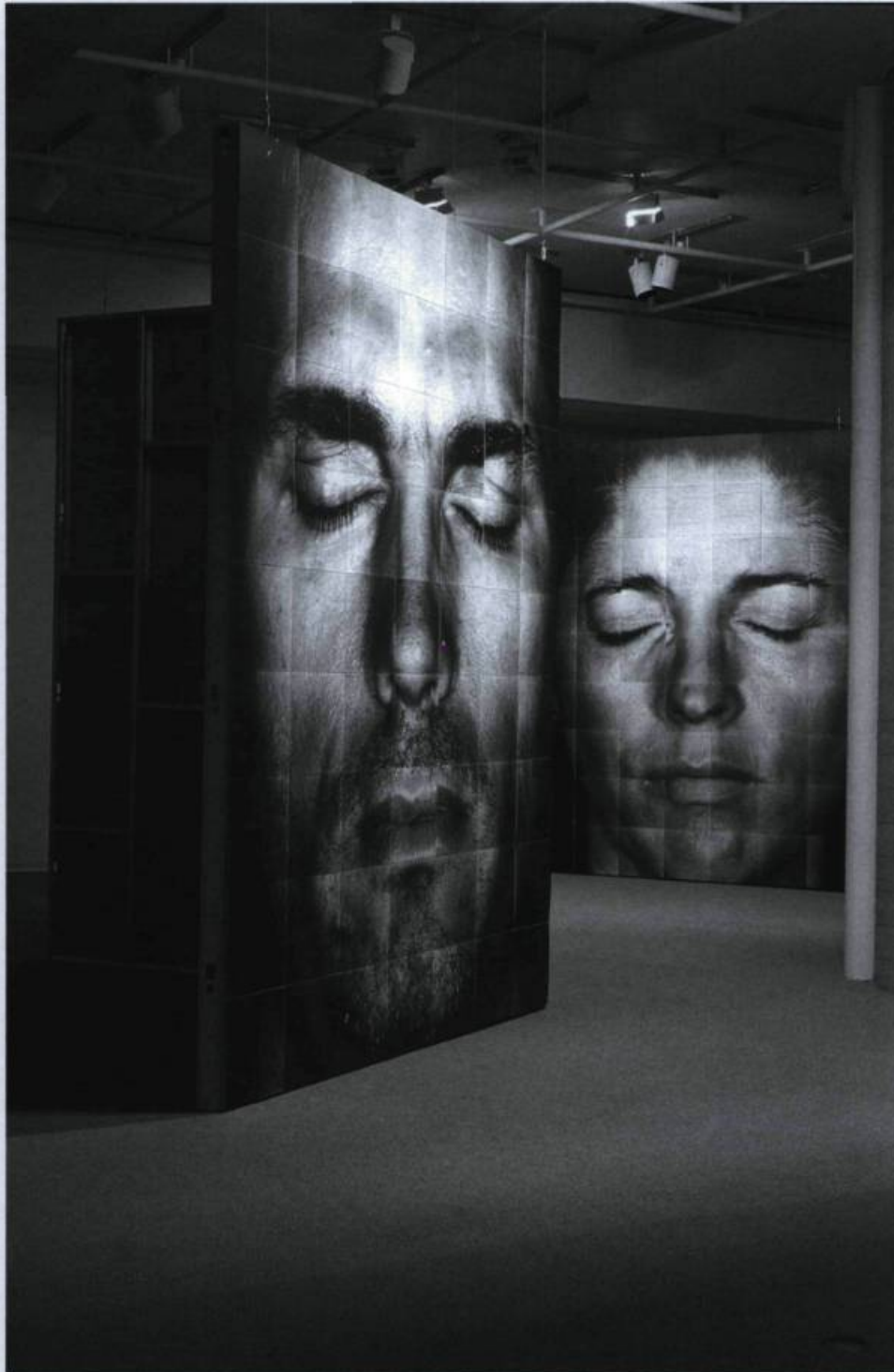
Roberto Pellegriuzzi, Les écorchés , 1999, 325 x 251 cm.

« La reine des géants, qui décidément appréciait beaucoup sa compagnie, lui fit construire, par les meilleurs artisans du royaume, une jolie petite boîte, confortablement meublée d'un hamac fixé au plafond, de deux chaises et d'une table vissées au plancher [...] Le capitaine la nommait fort joliment "my Travelling Closet", sa chambre de voyage. [...] Par les soins de Roberto Pellegriuzzi, la Galerie de l'UQAM s'est transformée, le temps d'une exposition, en une telle chambre de voyage. Ses œuvres récentes — trois paires de portraits photographiques monumentaux (325 x 251 cm) intitulées Les écorchés — semblent des fenêtres grillagées, à travers lesquelles nous pouvons apercevoir, comme Gulliver lui-même depuis sa petite boîte, des visages de géants endormis » (Olivier Asselin, « Le regard aveugle », critique de l'exposition Terra incognita. Les écorchés , Galerie de l'UQAM, du 1 er septembre au 9 octobre 1999).