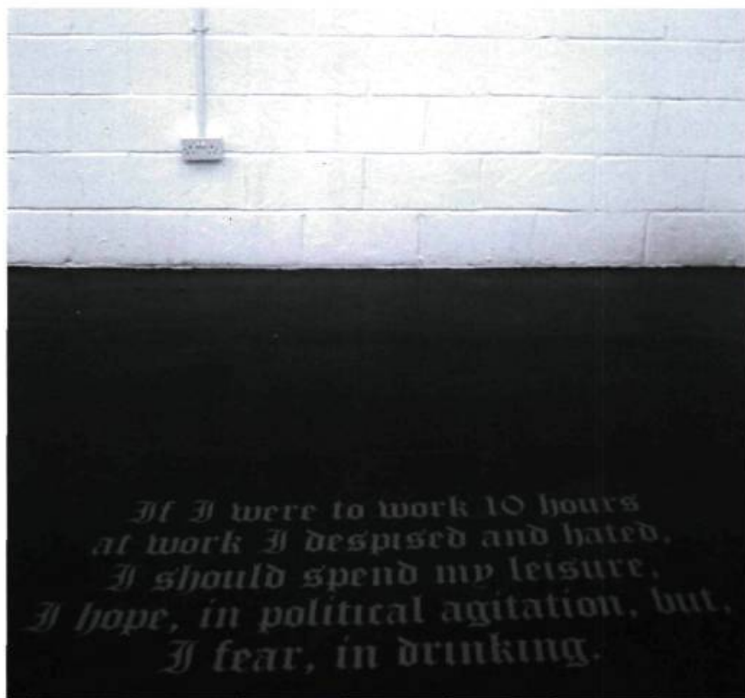
Mathieu Beauséjour, Three Internationales (Diversion) , vue de l'exposition ayant eu lieu à Londres à la Galerie Space - The Triangle du 15 janvier au 15 février 2005.