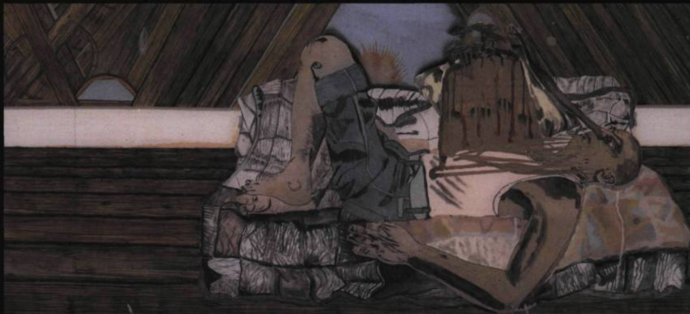
Max Wyse, Geophagic Man 2 , (61 x 122 cm), 2007.