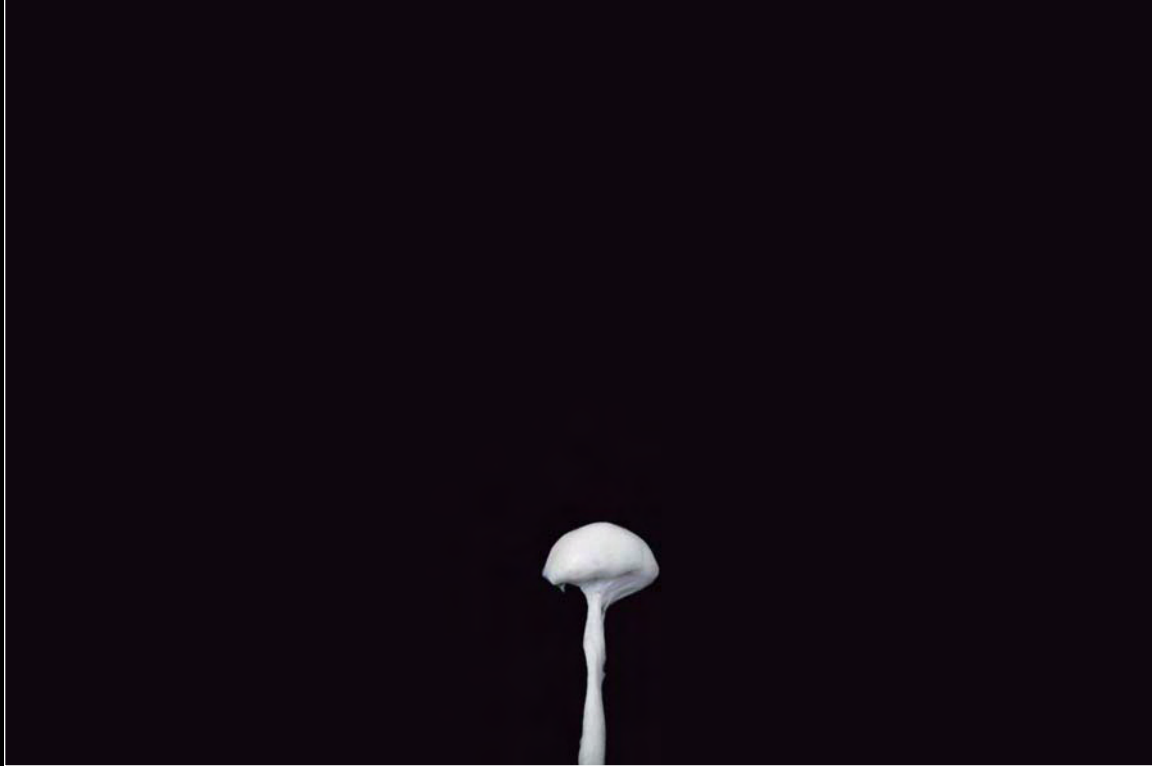
Glenda León, Hongo Masticado de la série Ideas Masticadas Dibujo : goma de mascar sobre papel fotográfico, 18 x 23,5 cm (2008).

le concept de part en part jusqu'au point le plus extrême du regard vers la ligne d'un horizon. Línea Masticada fait écho à Prolongación del deseo ; une œuvre photographique résultant du montage de cent photographies en une seule et même image. Elle témoigne d'une longue file de citadins qui aspirent à se rafraîchir d'une boule de crème glacée et dont la scène se prolonge tout un jour et toute une nuit. Cette photographie saisie dans la durée, image de la permanence et soif des aspirations humaines, souligne le récit d'une épopée. L'être humain n'est qu'un long ruban coloré qui se presse vers le désir, chargé d'éphémère, de se « fondre » à une boule de glace, unique corps conducteur. Cette œuvre me rappelle Después de la lluvia , une photographie où dominant pour tout univers la terre et le ciel. L'artiste a retouché ce fond de brins de laine figurant ainsi l'arc-en-ciel. Elle affirme, par ce geste, que les lois irrépessibles de la nature sont en nous.