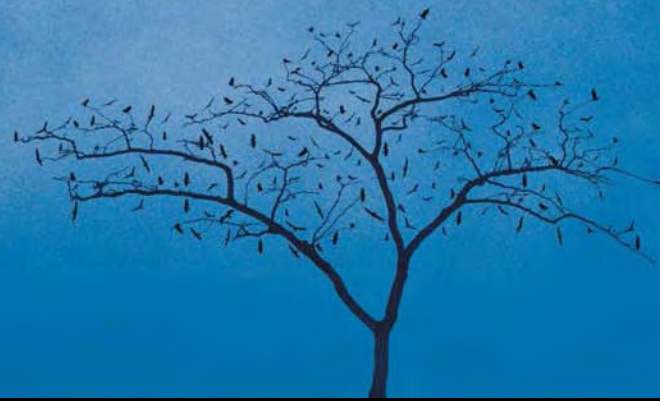
Glenda León, La Perfecta Pertenencia Fotografía, lambda print, 80 x 120 cm (2005)

point de nous y « brûler » le temps d'un instant. En effet, une fois entrés dans l'enceinte, nous nous sentons portés par le vif élan d'aller à la rencontre d'un désir, tel Ulysse attiré par le chant des sirènes. Symptomatique signal. Glenda León nous a tendu ce grave et merveilleux piège. L'aveuglante clarté de n'avoir pas rêvé.