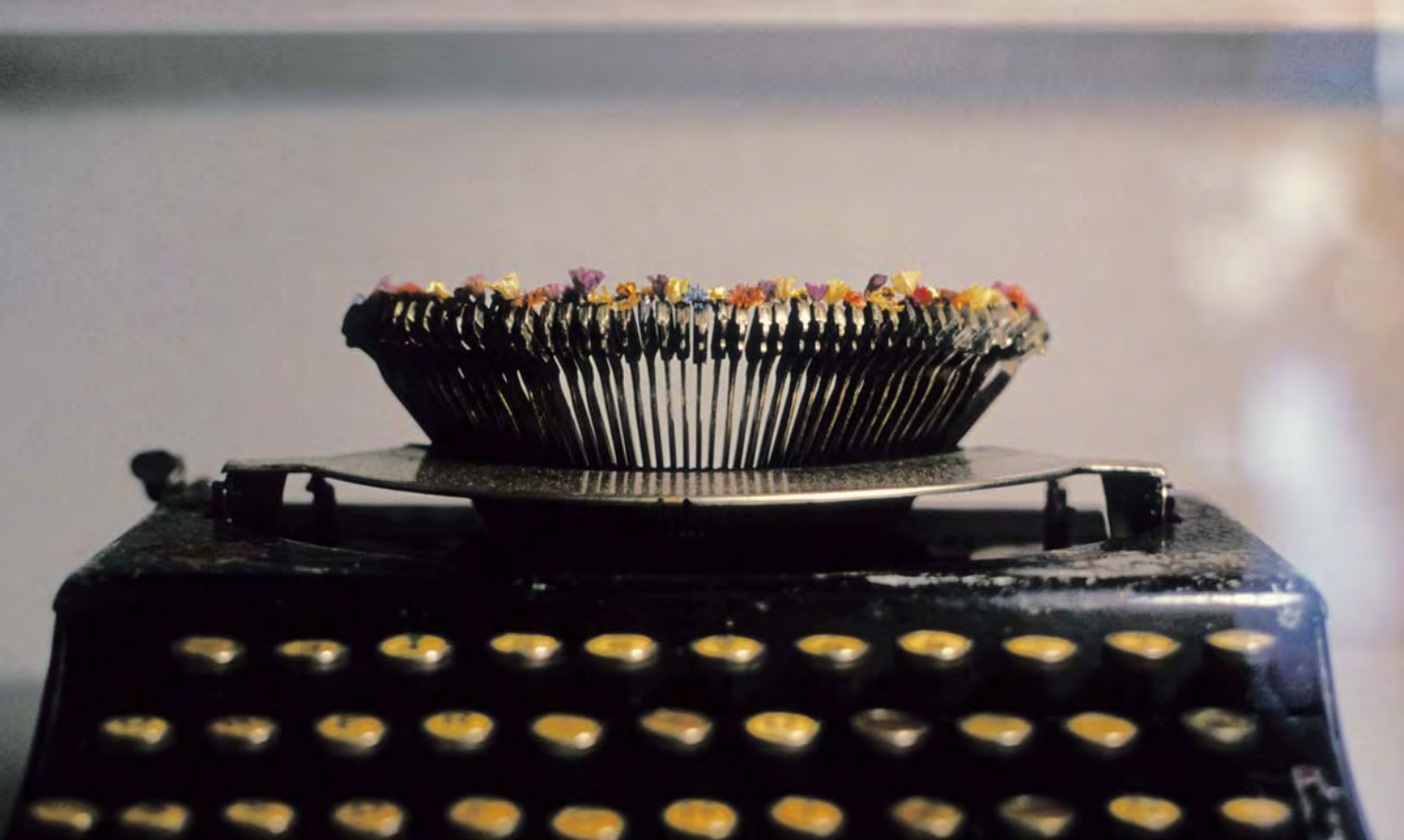
Glenda León, Objeto Mágico Encontrado (#3) Objeto : maquina de escribir, flores secas, 40 x 20 x 20 cm (2003) Fotografía, 78 x 120 cm (2005)

sous-titre de Genealogía , l'une de ses premières œuvres, significative, en cela, de sa position esthétique dans un contexte qui réinvente l'idée d'autonomie artistique. Dans Genealogía , Glenda León a photographié les boutons d'allumage de trois téléviseurs, de marque américaine, russe et chinoise, signes des idéologies qui se sont fait sentir à Cuba à divers moments de son histoire, ainsi que des mécanismes qui les ont mises en place. Par un geste simple, consistant à isoler ces boutons « témoins », l'artiste a recomposé la trame du processus qui a permis sa répétition, provoquant une inversion subtile de la source d'écoute. Une condition très performative, selon Glenda León, c'est la conscience d'en performer la signification.