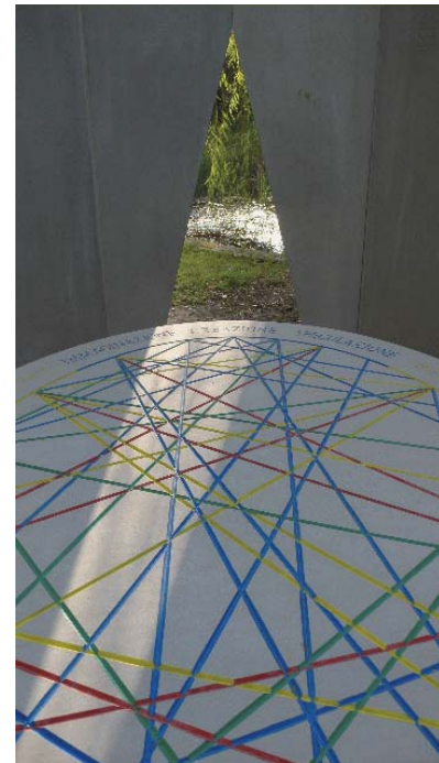
La Fabbrica della Memoria, 2006 (vue de l'intérieur) Pietra serena 4 x 3 x 2 m, Villa Medicea La Màgia, Quarrata

Les œuvres des Poirier, toujours créées in situ , font corps avec un lieu, s'y frottent et en explorent l'impression — l'habitant .