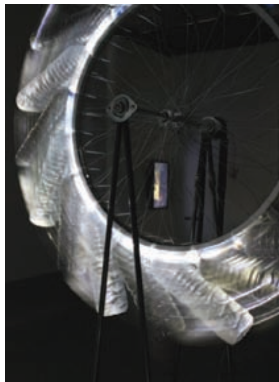
Diane Landry, Chevalier de la résignation infinie (détail), Optica, centre d'art contemporain, 2010.

On reconnaît dans les pales un motif déjà utilisé par l'artiste, notamment dans sa série Le déclin bleu , dont deux mandalas ont été présentés lors de sa récente rétrospective au Musée d'art de Joliette. Les silhouettes de plastique étaient alors exploitées pour leur transparence : grâce à un arrangement circulaire autour de corbeilles ajourées et sous l'effet de glissoirs électroluminescents, leurs ombres devenaient méduses, corolles ou dentelles. Elles se déployaient puis se rétractaient lentement sur les murs, dans un ballet qui évoquait pour d'aucuns la respiration, pour d'autres l'éclosion. Dans l'œuvre qui nous intéresse ici, le mouvement perpétuel « artificiel » infligé aux éléments de la nature ne réfère pas tant à l'organique qu'à l'oscillation entre le machinique et le cosmique : dans leurs révolutions, les roues poussent le sable emprisonné dans les bouteilles à glisser le long des parois, éteignant puis dévoilant l'extrémité lumineuse de chacune d'elles, comme de microssoleils qui se couchent puis se lèvent. Comme si le cycle du jour et de la nuit avait été encapsulé. Ainsi la nature et le cosmos, captifs de l'engin mécanique, sont forcés à une marche lourde de constance, et tristement obsolète. Dans cette ronde imperturbable, dans ces échantillons de sols et de lumière embouteillés, dans ce bruit de vent machinique d'une troublante régularité, dans ces