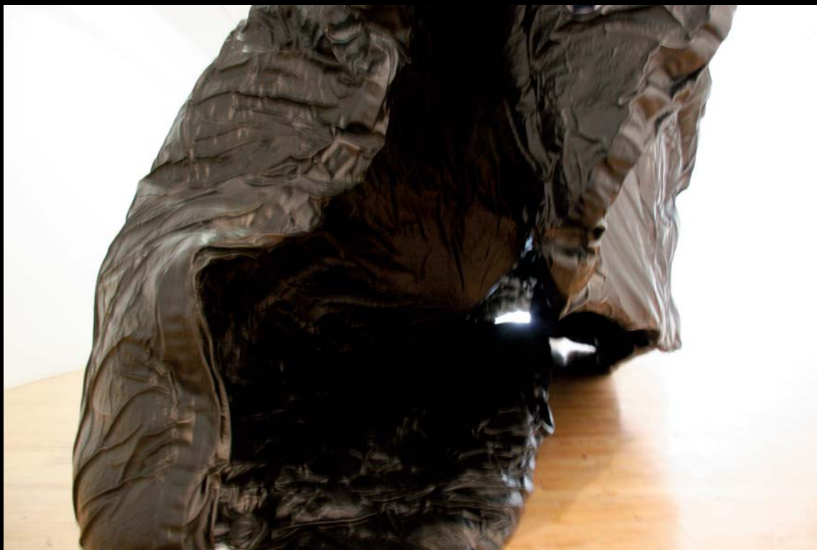
Jacques Bilodeau, Transformable 2, intérieur, 2006.

galvaudé, et il importe de plonger dans son étymologie pour bien comprendre sa portée dans la pratique de Bilodeau. La racine du mot renvoie à péril , épreuve, risque et danger. L'expérimentateur se tient à la limite des choses, du connu, du convenu, il ne cherche pas à innover (logique moderniste) ou à interpréter, mais plutôt à inventer. On se rappelle l'injonction de Deleuze et Guattari : « Expérimentez, n'interprétez jamais. » Il s'agit pour Bilodeau d'explorer les possibilités d'une situation spatiale inédite en adoptant une attitude résolument expérimentale.