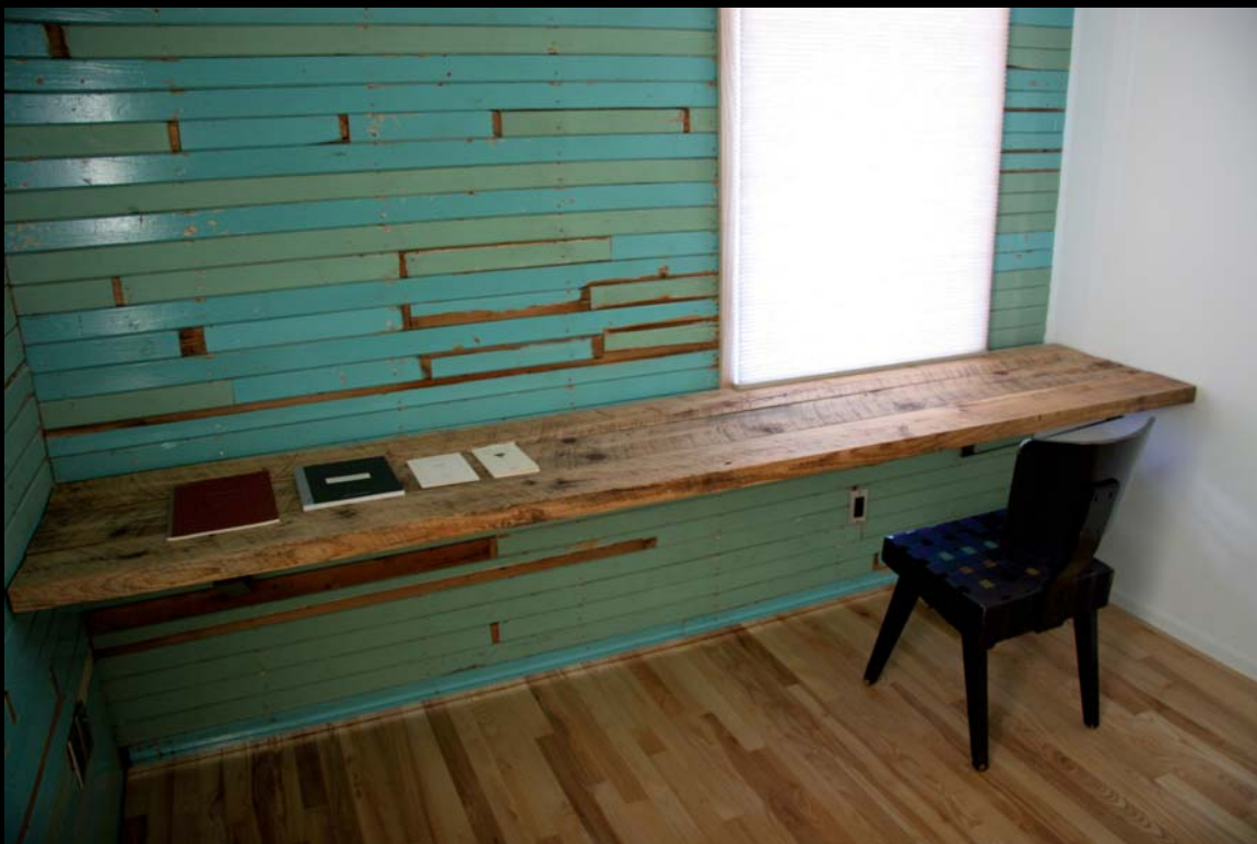
Jacques Bilodeau, design pour le CIANP, 2008.