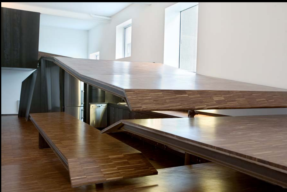
Jacques Bilodeau, Studio Cormier, vue du module fermé, 2003.