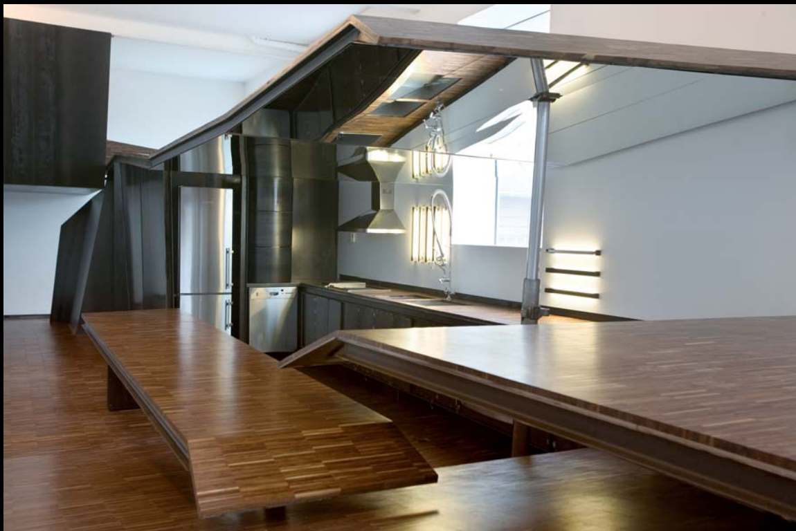
Jacques Bilodeau, Studio Cormier, vue du module ouvert, 2003.