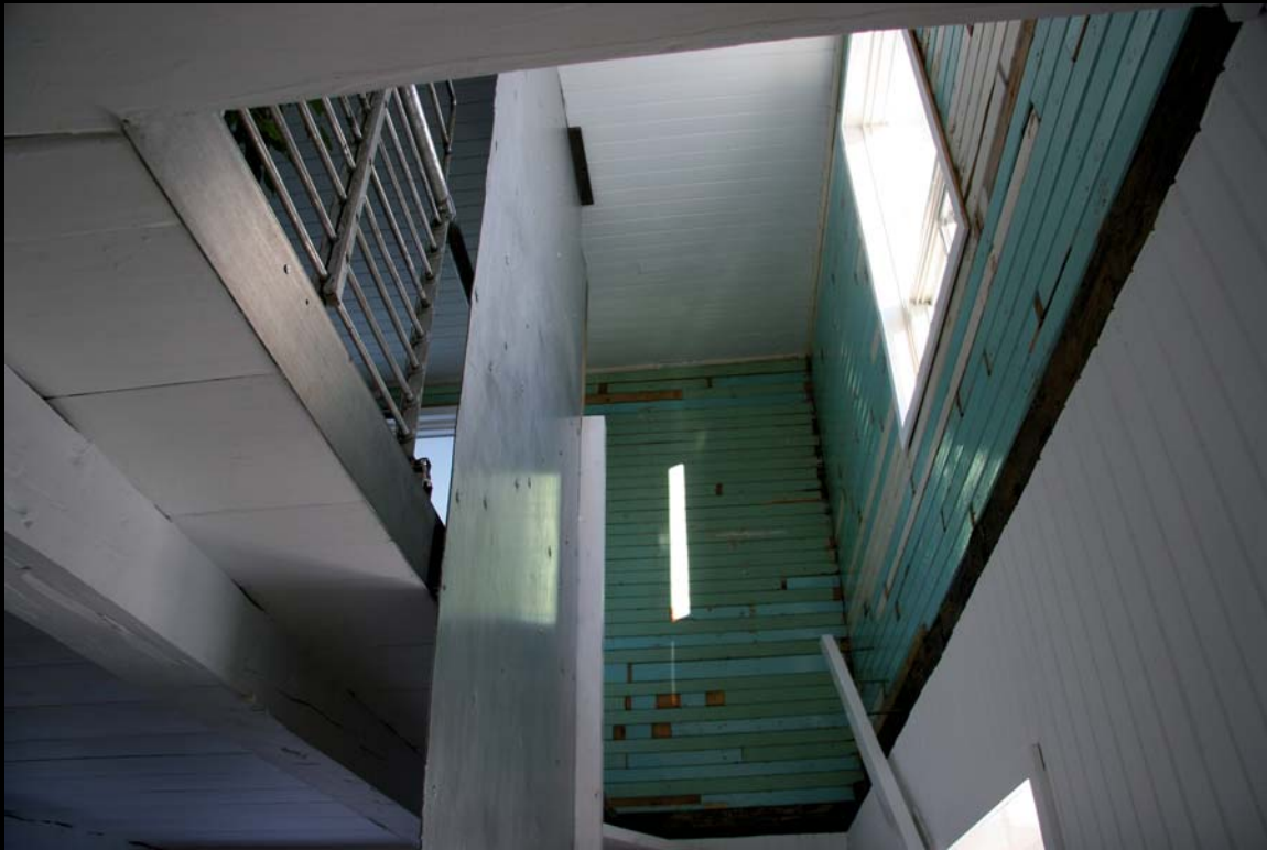
Jacques Bilodeau, design pour le Centre International Art, Nature et Paysage (CIANP), Saint-Hilarion de Charlevoix, 2008. Photo Jacques Perron