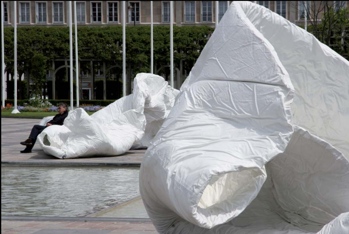
Jacques Bilodeau, Dessus, dedans, dessous, 2007, Biennale d'Art Contemporain du Havre. Commissaire : Claude Gosselin.