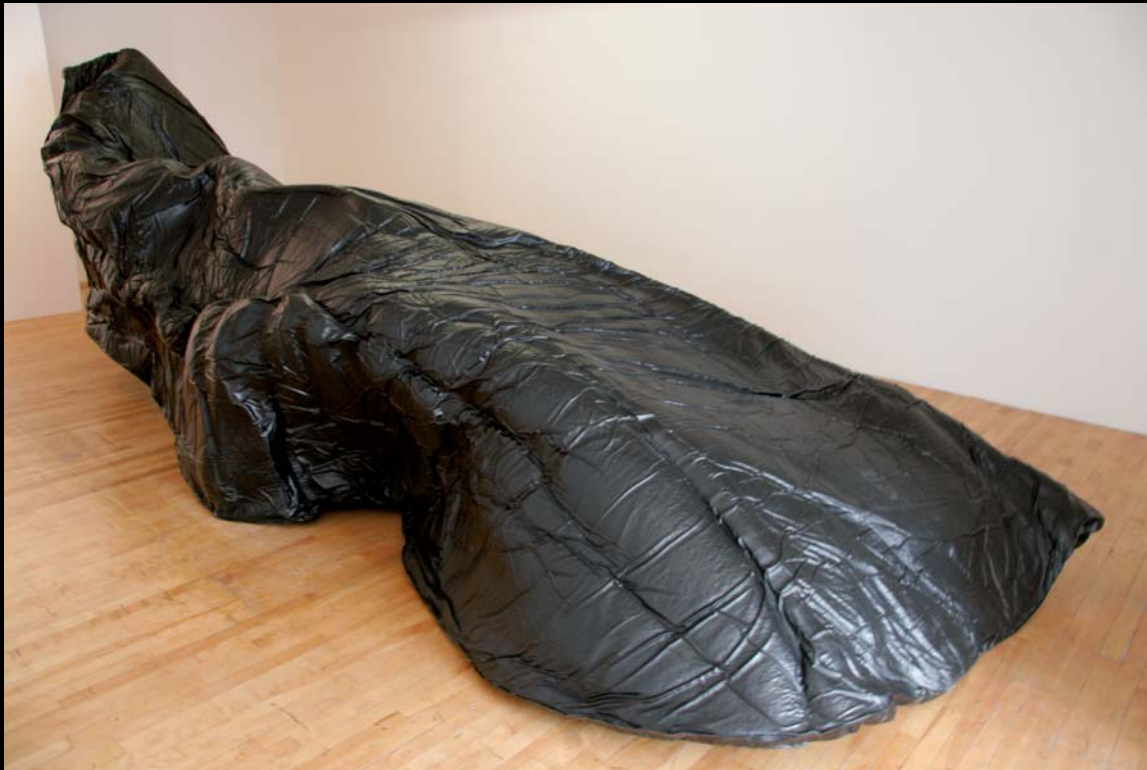
Jacques Bilodeau, Transformable 2, 2006, sculpture.

maintenant. Comment Bilodeau va-t-il s'y prendre pour insuffler au corps une nouvelle énergie ? En prenant appui sur cette pensée troublante de Spinoza : « On ne sait pas ce que peut un corps. »