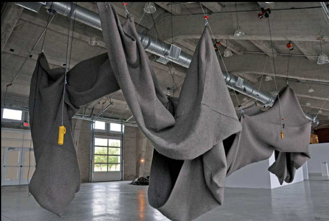
Jacques Bilodeau, Faire son trou, 2010. Biennale Trafic Art, Chicoutimi. Commissaire : Nicole Gingras.