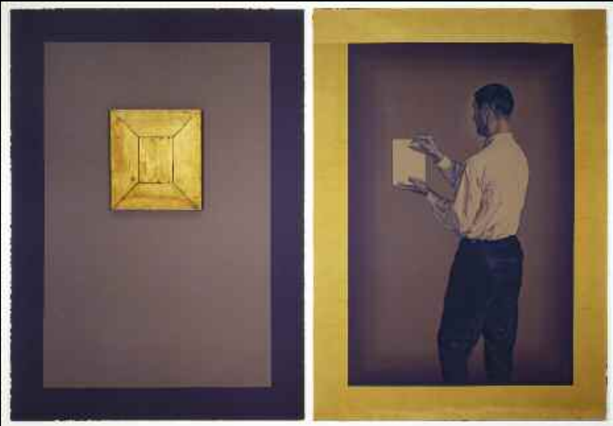
Porteur de relique, 1992. Huile et bois sur toile, 213 x 312 cm. Collection du Musée national des beaux-arts du Québec.