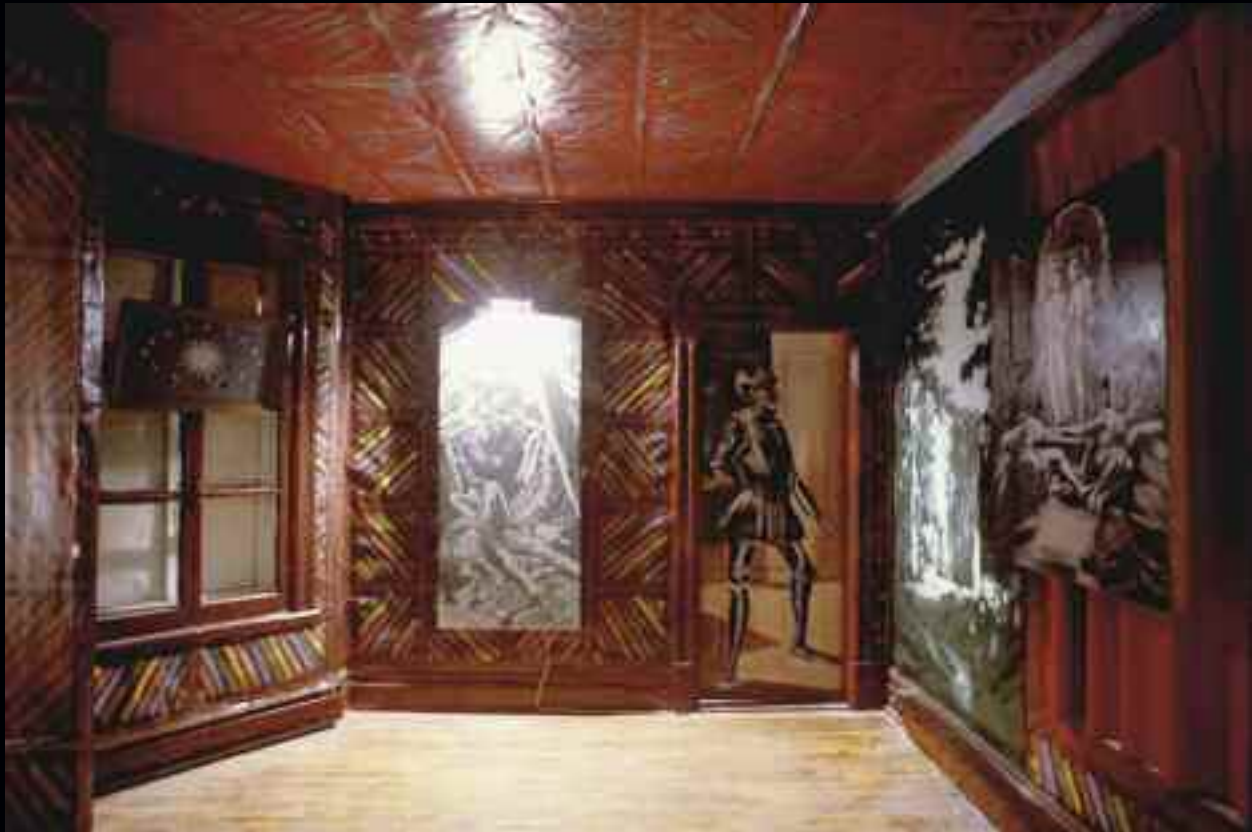
Vue d'exposition. Appart'art actuel, Montréal, octobre 1984.