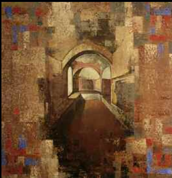
Sans titre (Catacombes de Priscille), 1987. Huile sur toile, 152,5 x 152,5 cm. Collection particulière.

Puisque à cette époque son regard se tourne souvent vers le passé, il apparaît normal que les ruines romaines et autres artefacts de l'Antiquité, de même que les trésors artistiques renaissants, baroques et néoclassiques, transigent vers son œuvre à partir des images de cartes postales et de gravures anciennes. Un nouveau paradigme est construit : il met en images l'architecture dans la peinture et celle-ci n'est plus soumise aux cadres du bâti. Comme l'écrit Dorion, « [l]orsque j'ai effectué le passage de l'installation à une peinture plus traditionnelle, c'était comme si je passais de l'investissement d'un espace architectural à la représentation de celui-ci » (« Pierre Dorion », De la perspective... dans l'art contemporain , Francine Papineau et Andrée Matte commissaires, Saint-Jérôme, Centre d'exposition du Vieux-Palais, 1993).