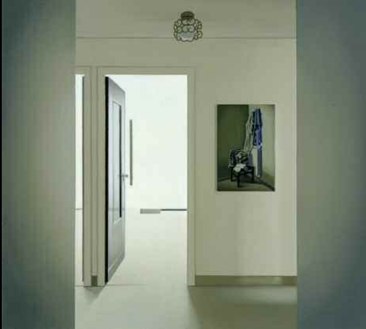
Vestibule (Chambres avec vues), 2000. Huile sur toile, 26,5 x 38 cm. Collection particulière.

Ces missions photographiques après le retour en atelier prennent les allures d'une suite de paysages oubliée du superflu. Ses « vedutae » ne sont pas dénotatives, elles ne décrivent pas, elles proposent une atmosphère de fixité permanente.