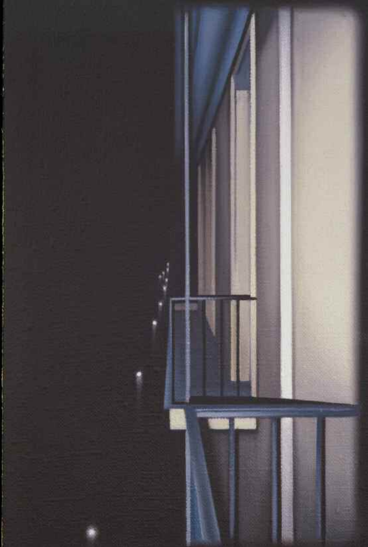
Naples III (Balcon), 1996. Huile sur toile de lin, 41 x 27 cm. Collection de l'artiste, avec l'aimable permission de la galerie René Blouin, Montréal.