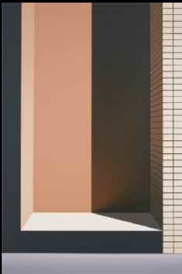
Alcôve (19th Street), 2008. Huile sur toile de lin, 183 x 122 cm. Don de M. Jamie Johnson ; collection Musée d'art contemporain de Montréal.

Tout récemment, sa rétrospective Pierre Dorion au Musée d'art contemporain, à l'automne 2012,