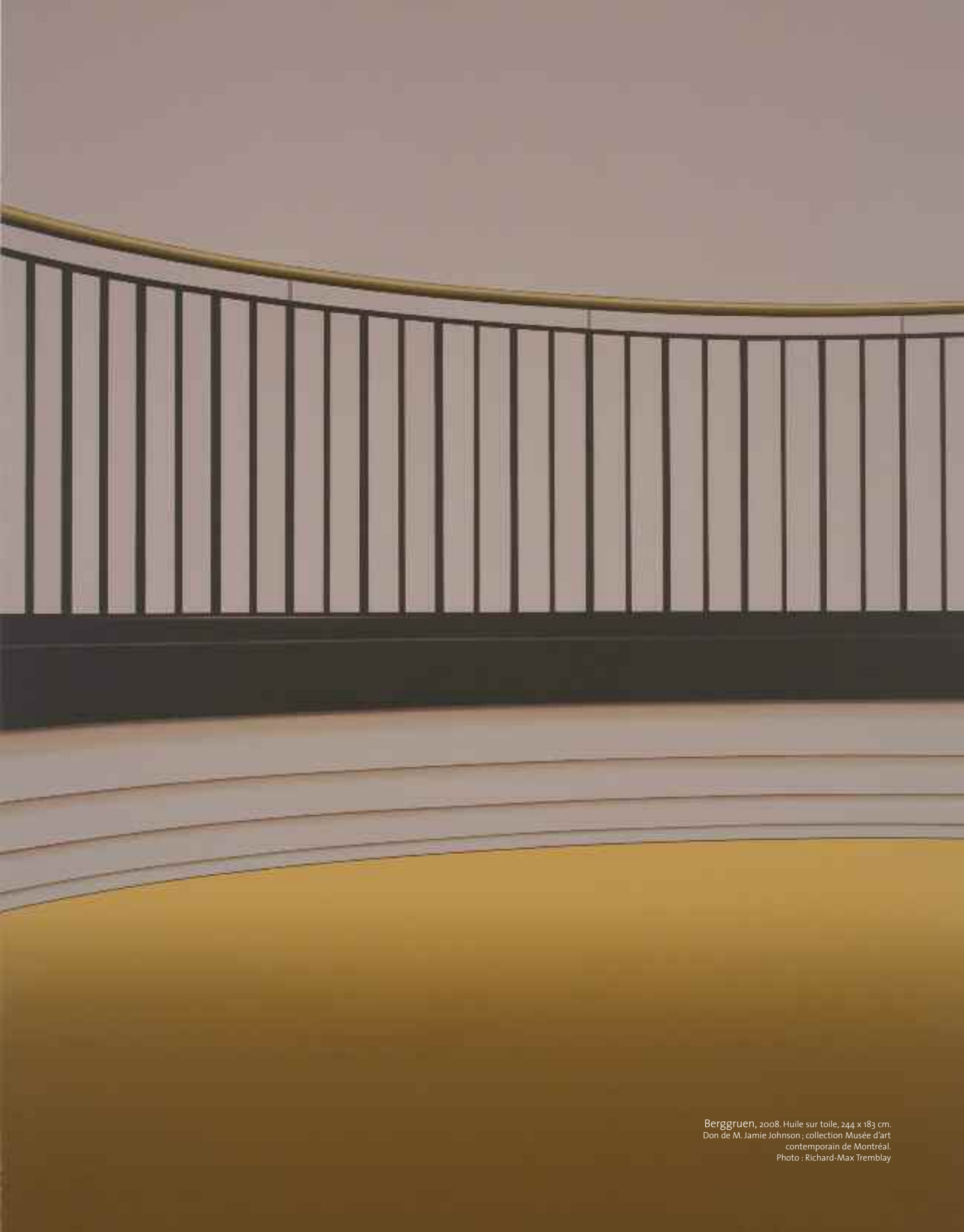
Berggruen, 2008. Huile sur toile, 244 x 183 cm. Don de M. Jamie Johnson ; collection Musée d'art contemporain de Montréal.