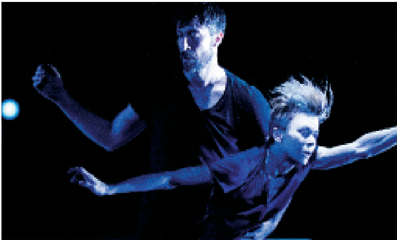
So Blue .