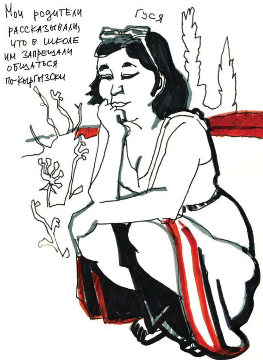
« Mes parents m'ont raconté qu'on leur avait interdit de communiquer en kirghize à l'école. » Dessin de la série Séjour au Kirghizstan , 2014 Crayon feutre sur papier