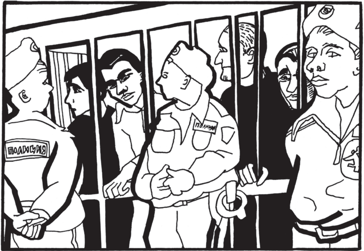
Prisoners of May 6, 2013 Dans le cadre du projet Drawing the Court, 2013-2014 Encre sur papier