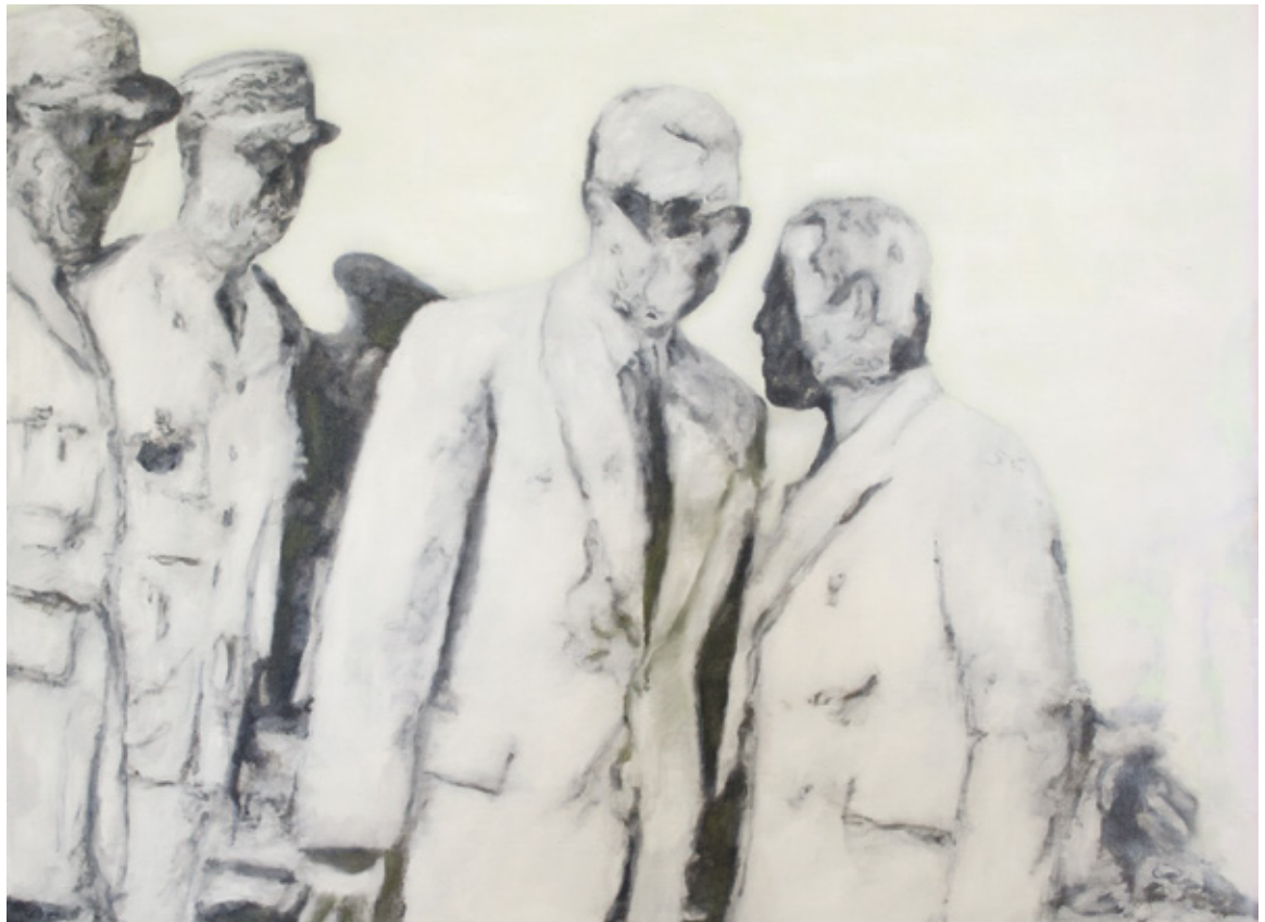
Phantom Shot , 2013 Huile sur lin, 60 x 81 cm

Page suivante : Totale paranoïa n° 2 , 2018 Collage et acrylique sur toile, 182,9 x 121,9 cm