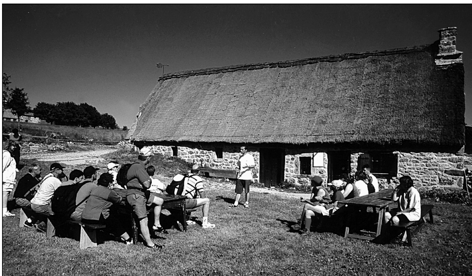
Animation Jasserie du Coq Noir. Parc naturel régional du Livradois-Forez.

Il convient de rappeler que les pouvoirs publics commanditaires (DATAR) cherchent à accompagner le développement rural de façon efficace. Dans le schéma de pensée actuel, la performance du secteur d'activité passe par une offre de produits et services de qualité, des entreprises compétitives, des professionnels formés. Reste à savoir si l'ensemble de ces concepts est représentatif des