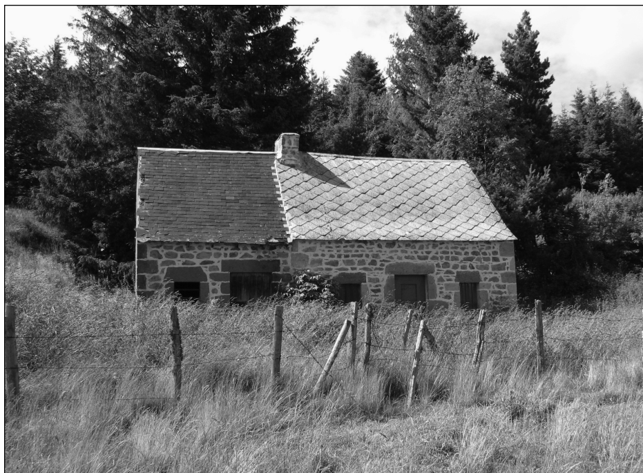
Un buron d'estives à réouvrir aux visiteurs. Puy de Dôme.