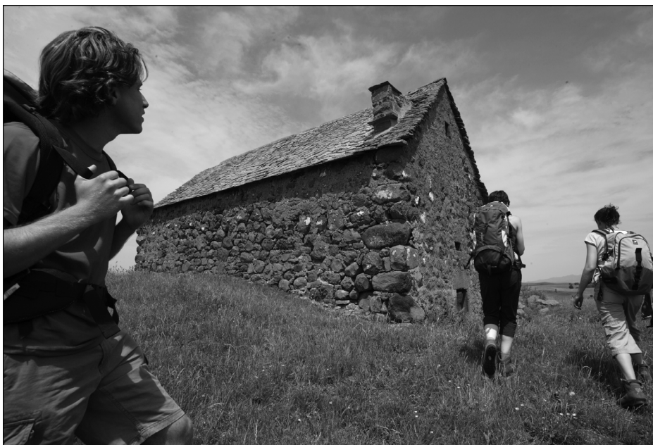
Randonnée dans le Cantal.

Gîtes ou chambres d'hôtes constituent, nous le pensons, des produits bien différents. Cependant, leur rattachement à tel ou tel