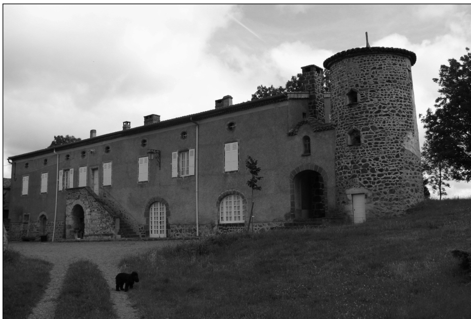
Gîte de groupe. Domaine de Chagourdat dans le Puy de Dôme.

Cette catégorie choisit l'hébergement touristique à la campagne comme élément d'un projet de vie : « Il arrive un moment où l'on aspire à autre chose. Donc, on a cherché une méthode pour changer un peu de style de vie ; on avait envie de revenir en