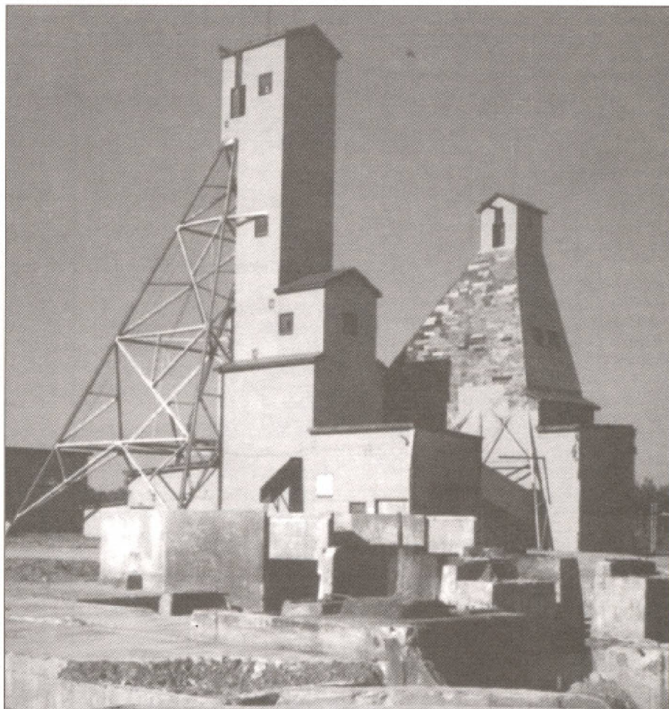
Chevalements de la mine Lamaque (carte postale distribuée par la Cité de l'Or et la Corporation du Village minier de Bourlamaque).

En Abitibi-Témiscamingue, en plus de la grande nature qui attire bien des amateurs de plein air, des sites historiques nom-