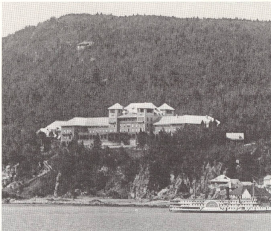
Le célèbre Manoir Richelieu à la Malbaie. Au début du XXe siècle, les bateaux à vapeur y transportaient les touristes de toute l'Amérique du Nord.

1936, « Les bonnes routes de la Province de Québec, leur signalisation, l'ensemble de son hôtellerie et la politique de bon accueil de sa population joint à la magnificence inouïe dont la nature l'a dotée font de cette Province française un endroit idéal où les visiteurs peuvent trouver tout ce qui est nécessaire au charme de leur esprit, à l'apaisement de leur fatigue, au