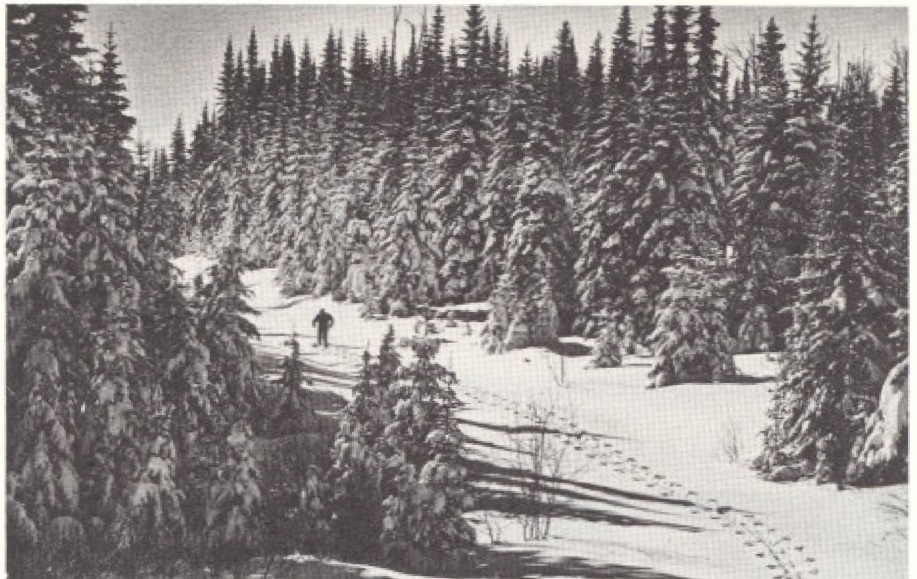
Un nouvel engouement pour les activités de plein-air. La magnificence de la nature québécoise y compte pour beaucoup... mais la nature n'est-elle pas belle partout?

chalet par les ménages; on peut facilement en déduire que la ressource villégiature est à la fois abondante et suffisamment attrayante pour que l'on accepte d'y consacrer des sommes fort rondelettes. On peut sans doute aussi ajouter que l'intérêt que porte les Québécois à la villégiature est une réponse probante à ceux qui s'interrogent pour savoir si la nature, au Québec, représente un attrait touristique.