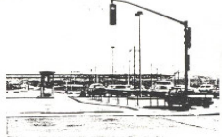
Vue vers le fleuve à Montréal, photo prise de la rue Dalhousie, 130 millions de dollars plus tard, on ne voit pas le fleuve.