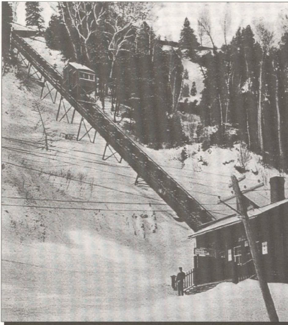
Le Parc de la Chute Montmorency à Québec. Enfin le futur, devrait-on dire, en considérant la valeur ajoutée locomotrice à la nature du site ! Mais malheureusement, une intégration du téléphérique à l'environnement qui laisse beaucoup à désirer avec des fils qui découpent le panorama, un bâtiment qui l'obstrue et une technologie en rupture historique. Photo d'époque de l'ancien funiculaire : celui qu'il aurait fallu reconstituer, au même titre que les tramways de San Francisco.

ser 9/10e de leur budget journalier pour juste dormir et se nourrir le soir.