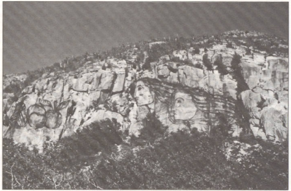
Le Couple... Élément central Culture - Nature. Cette gigantesque peinture rupestre, presque transparente et discrète, fait partie du projet touristique global de la ville du Mont St-Hilaire. Conçue par les mêmes auteurs que cet article, les profils soulignent les formes de la roche et prolongent l'histoire du lieu qui a vu naître Paul-Émile Borduas et une partie du «refus global».

Enfin, pour les villes comme Montréal, Québec, Trois-Rivières... il est probable que le tourisme dirigé et organisé par les minorités ethniques asiatiques, américaines et autres, en relation directe avec leurs pays d'origine, pourrait connaître un essor sans précédent.