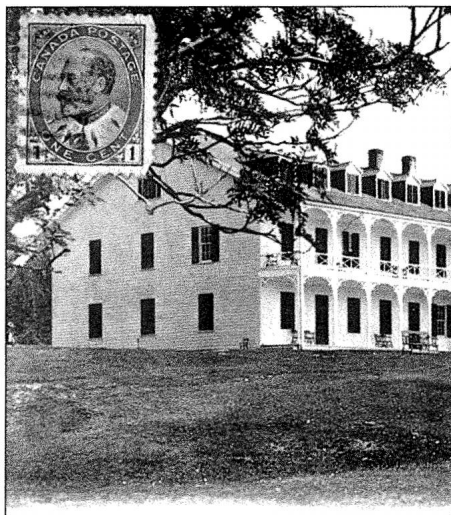
L'hôtel Tadoussac, commercialisé par plusieurs cartes postales dès le début de XX e siècle, Archives nationales du Québec (Québec).

Cette station de villégiature, organisée par la compagnie de navigation du Richelieu, devient le point de départ des excursions sur le Saguenay. Au XIX e siècle, un tel