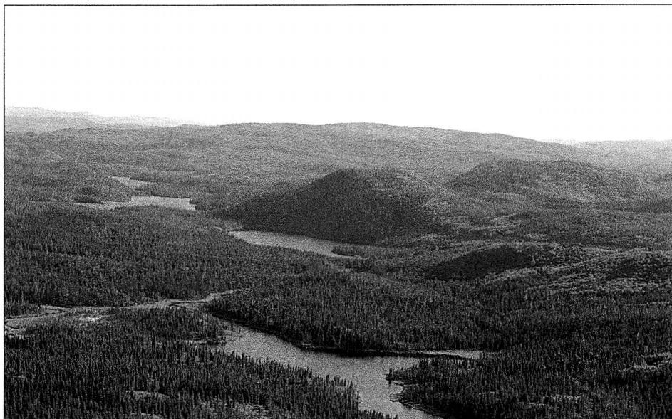
Vue aérienne du « Parc » des Laurentides, photo Pierre Lahoud.

En 1866, le parcours entre Métabetchouane et Québec est ouvert comme chemin d'hiver. Débute alors l'aventure de la route du « Parc ». Dès la fin des années 1860, colons et touristes aventureux s'engagent dans cette traversée. Malgré la popularité de cette artère de communication, le gouvernement émet, en 1883, un avis à l'effet que le chemin de Métabetchouane ne sera plus entretenu. « Les deux grands poteaux qui, à quatre milles de Stoneham, marquaient l'entrée solennelle du chemin du Lac-Saint-Jean, n'avaient plus qu'un sens historique » (Tremblay, 1978 : 146). Dix ans plus tard, le chemin de Saint-Urbain est abandonné et sera fermé à son tour. « Ce chemin dont la construction avait été entreprise en 1853 fut pratiquement abandonné en 1893 lorsque le chemin de fer reliant Québec au lac Saint-Jean arriva à Chicoutimi » (Saint-Aubin, 1987 : 11). Le gouvernement se serait-il trouvé des alliés pour accéder à ce territoire (Dussault, 1983) ?