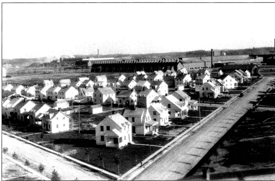
Panorama du premier quartier ouvrier et des usines, en 1927, Alcan, JON/27/2#1.

préservation (premier niveau), d'une mise en valeur (deuxième niveau) et d'une interprétation (troisième niveau) qui, en plus d'être cohérentes, doivent concourir à amplifier le signal de la ressource (ses significations originelles) sans jamais s'y superposer. Afin de développer cet appareil, dont les retombées culturelles seront aussi nombreuses que le lien entre la ressource et sa valorisation sera grand, un groupe d'étudiantes et d'étudiants inscrits à la maîtrise en gestion et planification du tourisme de l'UQAM iront dès cet été, grâce notamment à l'aide du ministère de la Culture et des Communications, « faire