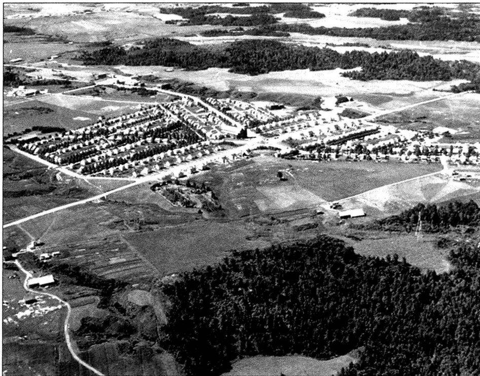
Vue aérienne de la « ville construite en 135 jours », plantée de 709 arbres en 1927, photo Canadian Airways, 1936, ANQC, fonds de la Société historique du Saguenay, Album Alcan 10.1.

L'approche que nous avons adoptée quant à la protection des intérêts d'Arvida, qui vise à constituer la ville en produit d'appel, reposait sur le postulat selon lequel le tourisme peut être un outil de développement culturel. L'équation est simple : la reconnaissance collective qui sous-tend le succès d'une attraction touristique reste la principale garante de la préservation de la ressource, tant en ce qui concerne la volonté de protection (nul ne penserait, aujourd'hui, à raser le Vieux-Québec ou à détruire les collections du musée du Louvre) qu'au regard des assises économiques d'un tel projet de conservation, qui ne peut être financé, dans le contexte actuel, que par un apport extérieur. Le tourisme, cette panacée (!), devient un