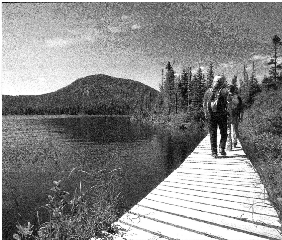
Parc national de la Gaspésie (Québec).

formes de tourisme non compatibles avec l'écotourisme (tourisme de masse, tourisme axé sur le prélèvement faunique) ;