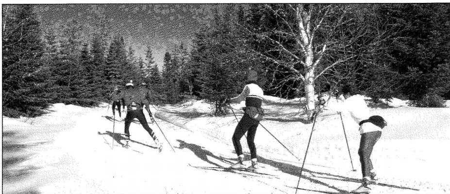
Camp Mercier, réserve faunique des Laurentides (Québec).

Le phénomène planétaire qu'est l'écotourisme se vit toutefois de façon très différente et soulève des enjeux qui varient selon les continents et la réalité des pays d'accueil. Alors que les pays développés peuvent compter sur un marché interne important ainsi que sur un marché international d'écotouristes, les pays en développement dépendent davantage ou sinon exclusivement des clientèles de pays développés. Des aspects comme le contrôle du développement et des opérations écotouristiques se révèlent des enjeux plus évidents dans les pays en développement que dans les pays développés. En effet, dans plusieurs pays exotiques, plusieurs établissements et infrastructures de tourisme sont, dans bien des cas, le résultat d'initiatives d'étrangers. En Europe et en Amérique du Nord, les mécanismes visant