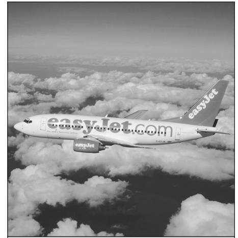
Un Boeing 737-700 de la compagnie à bas prix EasyJet.

Au titre des coûts d'exploitation et sous un angle endogène, les low cost exercent à partir d'aéroports dits désormais de proximité, peu onéreux et très accessibles. Les institutionnels d'ailleurs contribuent très largement à l'allègement des coûts (redevances aéroportuaires attractives, campagnes de « pub destination » ou de communication 8 ), récupérant leurs investissements avec les dépenses réalisées par les visiteurs/touristes. Cela a pour effet une diminution forte du coût passager 9 . Ces aéroports, trop longtemps délaissés, permettent par ailleurs des rotations rapides des working horses , que nous traduirons par chevaux de labours, que sont les Boeing 737, British Aerospace A146 ou Airbus A319.