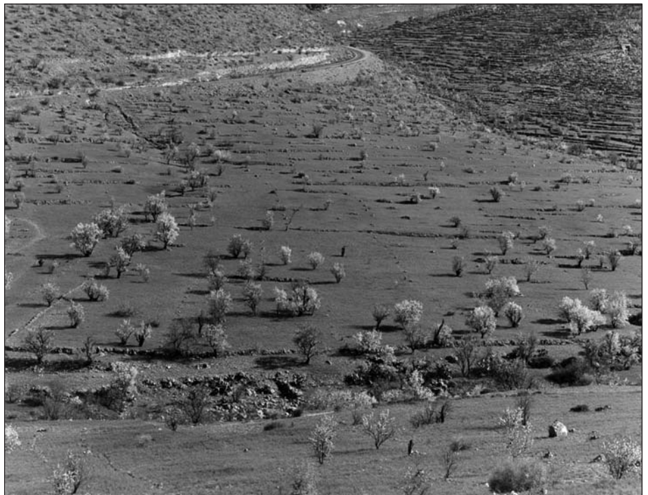
Oliviers en fleurs dans le Moyen Atlas (Maroc).

Le tourisme durable désigne « toute forme de développement, d'aménagement ou d'activité touristique qui respecte et préserve à long terme les ressources naturelles, culturelles et sociales, et contribue de manière positive et équitable au développement économique et à l'épanouissement des individus qui vivent, travaillent ou séjournent dans ces espaces ». Cette définition de l'Organisation mondiale du tourisme, publiée sur son site Internet, reprend les grands principes de la Déclaration de Rio de 1992 concernant le Développement durable, en les adaptant au secteur du tourisme. Le concept de tourisme durable incite à placer l'homme et l'environnement au centre de toute réflexion sur les stratégies de développement de l'activité touristique. Adopter le tourisme durable, c'est aussi et d'abord affirmer la volonté politique de maîtriser son développement en répondant aux différents besoins des acteurs qui vivent sur le territoire concerné.