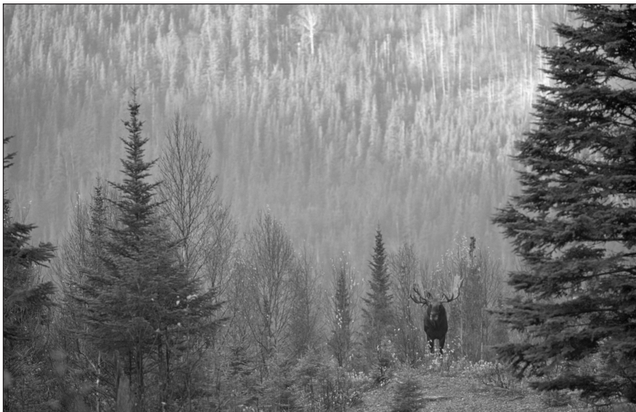
Original dans le paysage forestier du Parc national de la Gaspésie (Québec).

Dans un premier article, G. Beaudet analyse comment les rapports entre l'Homme et la forêt n'ont cessé d'évoluer et de se transformer et ce, depuis le Moyen Âge.