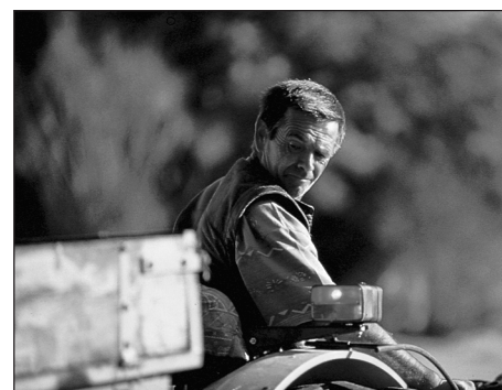
Un viticulteur dans ses champs de vignes.

Afin de mieux connaître les différences qui caractérisent les termes agrotourisme, agritourisme et tourisme à la ferme, nous avons réalisé une analyse comparative des documentations scientifiques et professionnelles. Les articles ou les documents scientifiques devaient avoir été publiés dans des revues avec comité de lecture, des comptes rendus de conférences scientifiques ou être des thèses de doctorat ou des mémoires de maîtrise.