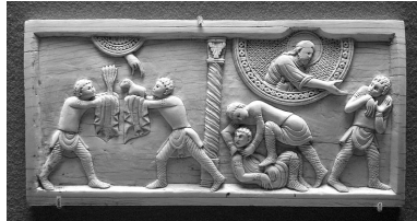
Le Sacrifice de Caïn et Abel; le meurtre d'Abel , ivoire, 10,9 x 22,1 cm. Plaque provenant d'un ensemble (devant d'autel ?), très probablement réalisé pour la nouvelle cathédrale de Salerne, fondée par Robert Guiscard et consacrée en 1084. Paris, Musée du Louvre.

Avec l'histoire de Caïn et Abel, on atteint en quelque sorte le point limite. Alain Gignac, dans son article, souligne l'aspect extrêmement elliptique du meurtre, dans la Genèse : il n'est pas décrit, relaté dans le détail, mais simplement énoncé sans la moindre information qui permette de s'en figurer les modalités. Aux artistes donc (et à leurs conseillers) d'imaginer les conditions concrètes du fratricide : mains nues, pierre, mâchoire d'animal 4 , bâton, couteau 5 .