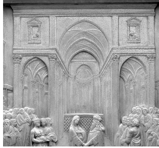
Lorenzo Ghiberti (1378-1455), La Rencontre de Salomon et de la reine de Saba, la porte du Paradis (1425-1452), Bronze doré, 79,5 x 79,5 cm, 1425-1437, Museo dell'Opera del Duomo, Florence.

le supérieur général de l'ordre des Camaldules, y joua un rôle de premier plan. C'est peut-être lui qui aurait fait en sorte que l'on substitue au « Jugement de Salomon » la « Rencontre de Salomon avec la reine de Saba », dirigeant ainsi les exégètes vers une autre lecture mettant en valeur le rôle de Florence dans cette grande entreprise de rapprochement 16 .