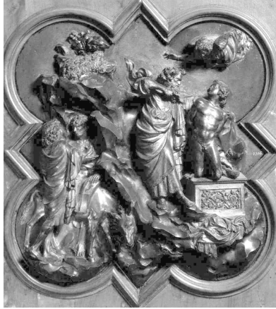
Lorenzo Ghiberti, Le sacrifice d'Abraham , bronze doré, 53,3 x 44,5 cm, Museo Nazionale (Bargello), Florence.

on l'aurait laissé libre de déterminer à sa guise le programme et le style de cette troisième porte. C'est lui qui aurait décidé de réduire à dix le nombre des compartiments 14 .