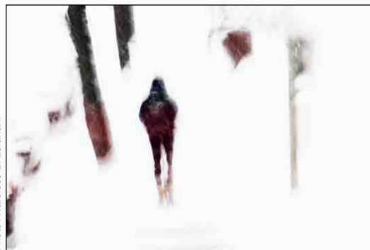
La ville dissimulée, 2015