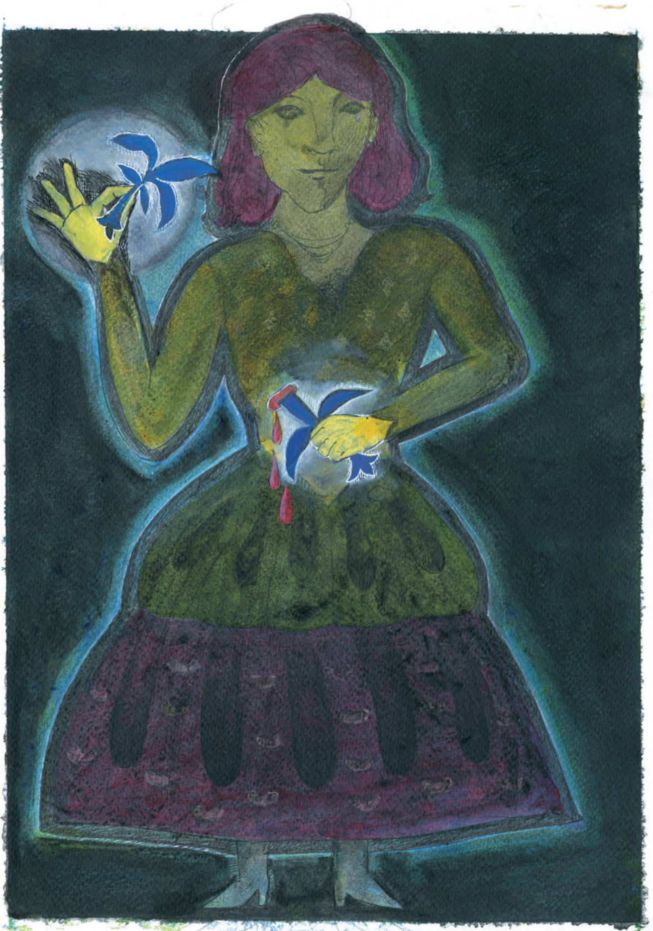
Illustration : Soroush Aram » » » »